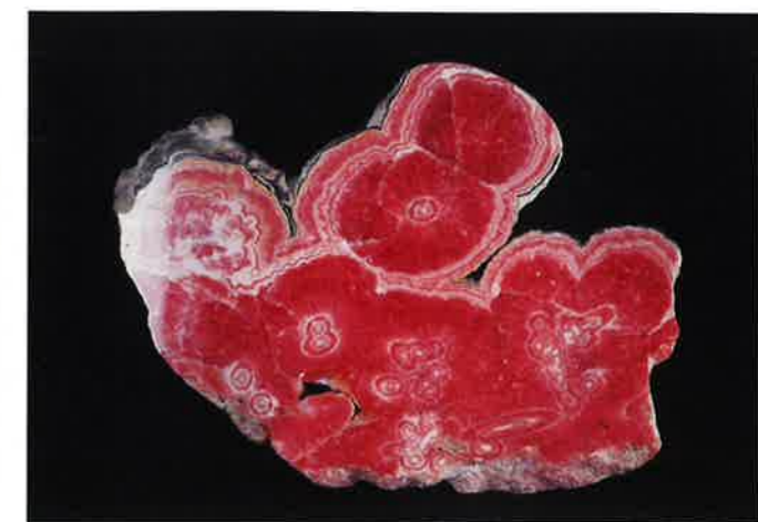
圖二：碳酸鹽家族中的菱錳礦