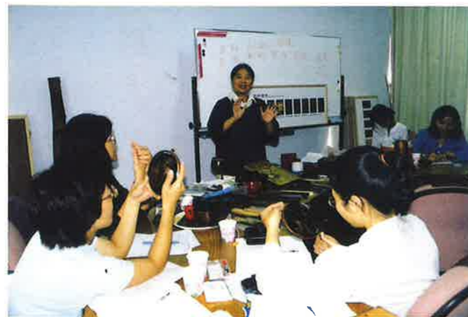
漆器製作維護講授