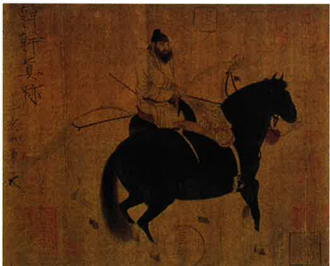
唐 韓幹 牧馬圖

故宮於巴黎大皇宮國家藝術館（Galeries nationales du Grand Palais, Paris）舉辦的「國立故宮博物院瑰寶（台北）—帝國的回憶」赴法特展，於一九九八年十月二十二日至一九九九年一月二十五日在法國展出後，深獲國際好評。這批展品涵蓋院藏書法、繪畫、玉器、銅器、瓷器與珍玩等各類文物精品。故宮將於三月五日至三月二十一日之間，在正館舉辦故宮瑰寶赴法歸國展，讓各界人士觀賞這批精彩文物。此外故宮也於一月底至四月於展覽大樓 204、206 陳列室舉辦「歷代楷書展」、二月十日開始於展覽大樓 312 陳列室舉行「名清瑤工藝特展」及從一月一日到三月三十日於展覽大樓 313 陳列室舉辦「宋版圖書特展」。