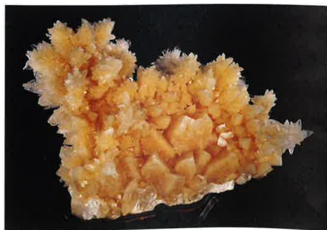
圖一：方解石的結晶