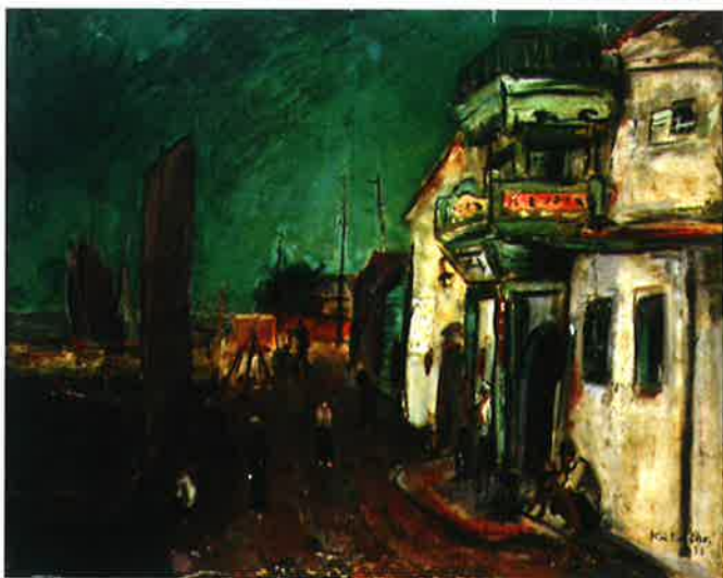
旗后福聚樓 1931 油畫 98.5 × 79