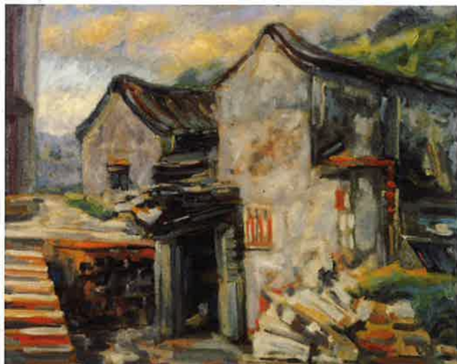
宜蘭藝術家新二月畫會會員作品

宜蘭縣立文化中心接辦各類藝術巡回展「吳正彥全省巡回美展」「陳春明半世紀竹雕藝術巡回美展」「林右正空間影像、觀念藝術巡回展」巡回至宜蘭，各展出二週。其餘還有當地藝術家創作聯展、師生聯展及學會會員展等，美術、工藝品展覽頻繁。還有，成立五年餘的蘭陽雅石會會員，將於三月二十三日起展現其藏品，和雅士共賞石頭的畫、美和自然，為期六天。