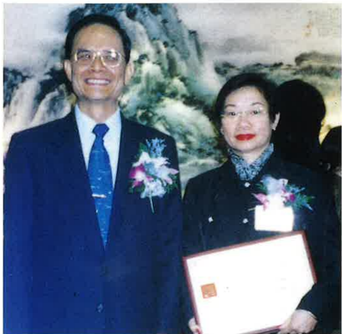
陳館長與教育部長合影

華岡博物館目前正積極籌備新的展示館，預定今年三月一日重新開幕，屆時將以最新的展示設計呈現館藏珍品，並推出嶄新的展覽活動。