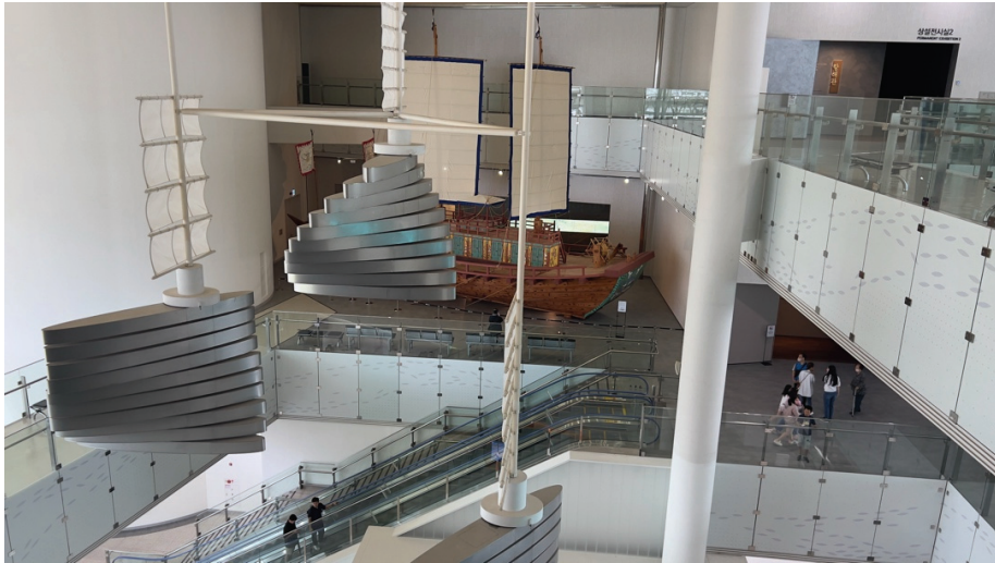
圖 2 館舍內部與多數科學館建築一樣，採用中庭開放挑空、穿透式設計，以空橋連接同樓層的各空間。

館舍從 2007 年開始籌備、2009 年動工，2012 年 7 月 9 日開館營運 3 。開館後一直很受歡迎，短短一年內就累積了 150 萬參觀人次，後續每年也都有近百萬人次，參觀人數上在韓國博物館中始終名列前茅。然而，這 10 年內，陸續面臨硬體開始老化、展示趨勢改變等內外因素，因此於 10 週年之際分區、分期進行更新。2022 年 9 月起，首先更新三樓與四樓的常設展，於 2023 年 9 月 15 日重新開展，2024 年至 2025 年間則完成了兒童廳更新，目前仍在進行圖書館更新。