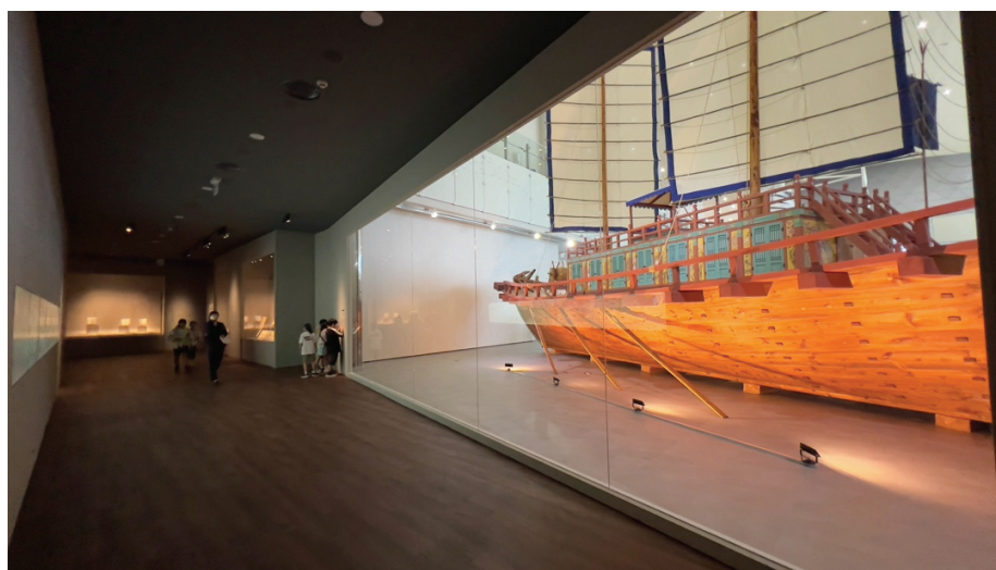
圖 12 更新配置上把信使船與長捲軸的信使圖搭配展示，並採用玻璃帷幕隔絕。有了足夠的觀看空間，觀眾可以更清晰看到船體全貌。