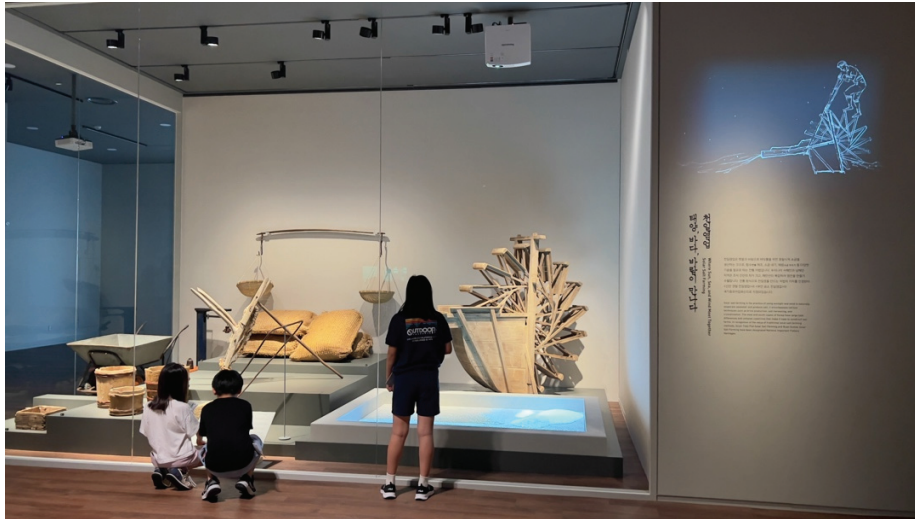
圖 16 展板上方以簡筆動畫展演說明內容，水車前搭配情境影像。

部分多媒體，則作為敏感、脆弱文物替代，像是前一節提到的信使圖動畫，可使展示不受限於日照與燈光問題，不但能保護原作，動畫中動起來的畫中人，也讓觀眾鮮明而趣味地看到那個的時代的人物民情風貌。同樣地，展覽就展示位置較深、物件較多的櫃體，製作了相應的媒體資訊系統，讓觀眾可以點選物件圖片，近一步觀看該文物細節，從展覽敘事以及物件雙重脈絡下，深入認識物件。