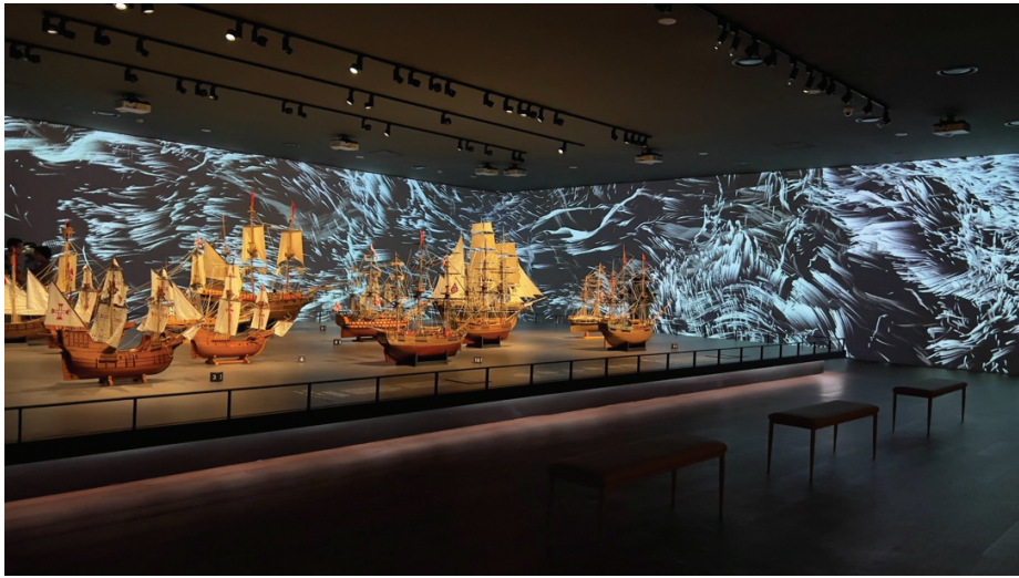
圖 13 航海館中各國船舶模型的展示，搭配著背景的多媒體投影，塑造出驚濤駭浪的競逐場景。

多元的數位應用，也是這次常設展更新的亮點之一。近 10 年來，數位多媒體在展示中的應用突飛猛進，國立海洋博物館也沒有錯過這個重要趨勢。在常設展更新中，除了增加兩處獨立多媒體展館外，融入展場的多媒體主要用在三大方面，一是情境塑造（如圖 13），再者是串場連結（如圖 14），以及整合替代文物。