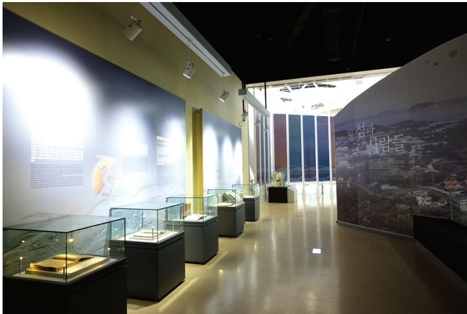
圖 9 過往的展櫃與高大展牆造成空間分割零碎，走道相對壓縮。

以空間動線配置而言，過往空間立面未充分使用，展櫃與展牆的分離系統，以及為了放更多的文字內容而產生的展牆，造成整體空間走道雖符合法規寬度，但相對感覺較壓迫（如圖 9）。在新的設計上，不僅整合櫃體，在展間內適當留空，展場中也減少了實體牆面的設計，多以玻璃帷幕、穿透性櫃體設計為代替（圖 10），減輕了不少視覺壓迫。