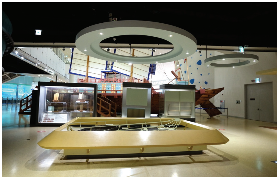
圖 11 原展覽中信使船被展櫃遮擋，且容易遭觸摸或登坐。