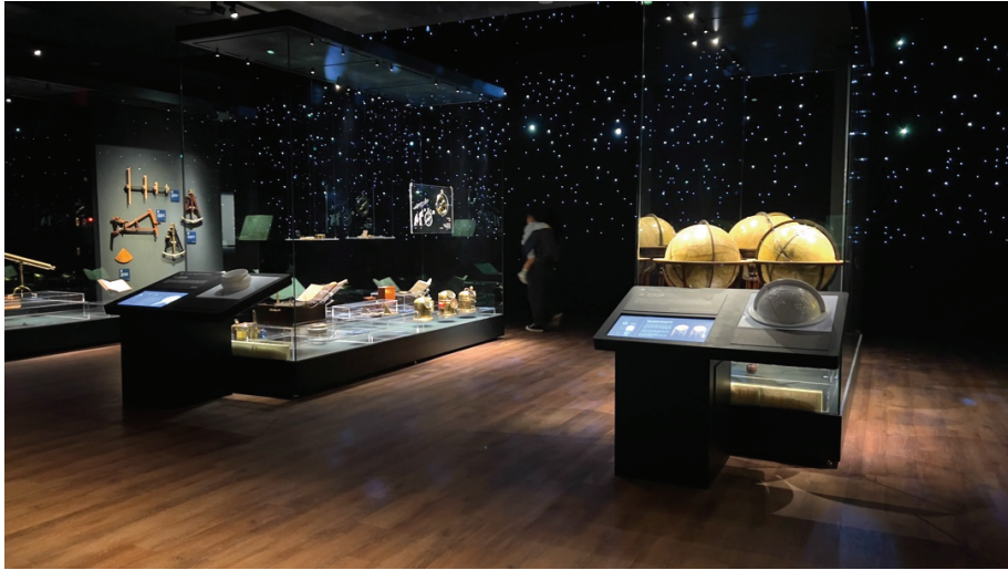
圖 10 新常設展空間調配下，玻璃高櫃間留設出的穿透性寬敞走道。

以比例 1/2 製作的遣日信使船，是館內重點展品之一。過往展示中，雖然可以走近看，但因量體過大，想看全貌時反而會被前方凌亂展櫃遮擋（圖 11），怕觀眾觸摸更是擺滿圍欄柱。在更新中，巧妙地運用了原空橋與天花的結構，將船鄰近展場側做成玻璃帷幕牆，不僅打造了船隻獨特的觀展空間（特大展櫃），也不會受到周邊展品紛雜的影響。同時因空間獨立，可以做更多燈光的規劃，突出重點展品。考量光線，走道另一側，則搭配了多媒體播放「會動的」信使圖，形成可以雙面觀看的走道空間（圖 12），既舒適且能互相對應圖面與船隻。同時，從挑空的大廳外側，也可以看見信使船威風的樣貌。