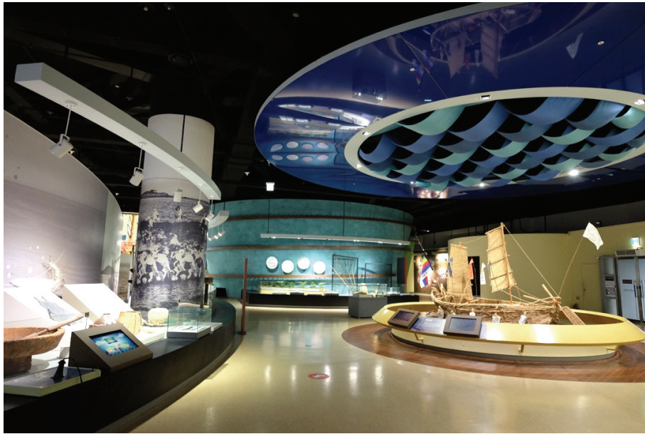
圖 6 原常設展展品展示多為檯面展示，較缺少立面上的層次。

雖然展示內容主題從綱要上看似沒有太大的變化，但空間上全盤重構，大幅提升了新常設展的參觀舒適度。舊展廳的規劃，雖然內容豐富，但文字量超標顯得知識爆炸，加以前面提到的單元分散、物件導向問題，塞滿展場的空間展櫃與展板，反而讓觀眾眼花撩亂。另外，展場的開放式動線，讓觀眾可以隨意穿梭在各個展版與展櫃間。處處都是重點，但彼此無明顯比重差異、優先度區分，造成展示主軸不夠明顯，宛如沒有重點，觀眾可以感覺得到策展者的誠意，但卻未必能領略展覽核心真義。