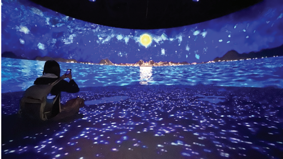
圖 15 媒體展館中的環型劇場，播映著海洋的前世今生。

除了這種大場面的情境投影，現場更貼心地應用了許多小而美的影像串場。每個展場端點過道，都會搭配該主題，製作約 30 秒的動畫，雖然風格簡易，但「會動」本身在展場中就是非常趣味的巧思，能吸引觀眾前往一探究竟。像是「生活中的海洋」展板上，就搭配簡筆線稿投影動畫，演示人如何運用此工具取得資源，讓觀眾快速了解展出的文物與展示主題間的關係（如圖 16）。