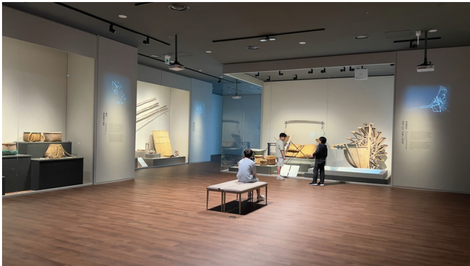
圖 8 調整後的展示模式，善用了立體空間中的高度、深度，相對來說，「省」出來的空間可用於情境造景、休憩空間。