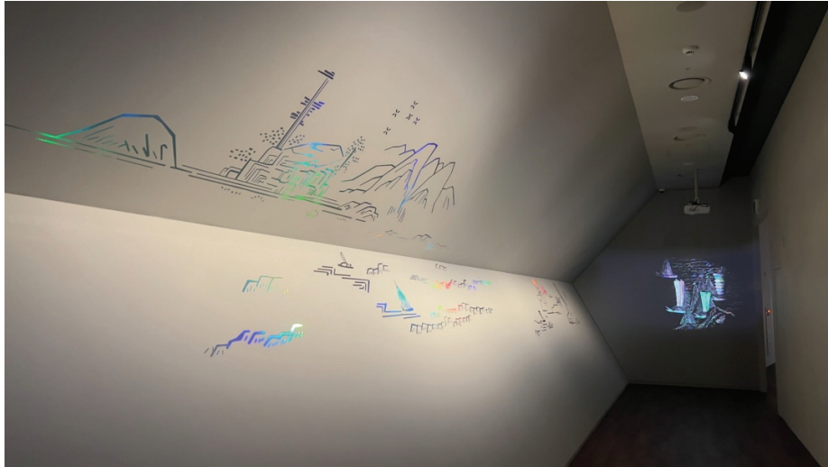
圖 14 「藝術中的海洋」單元中走道，以古畫元素雷射輸出搭配底端投影動畫。

透過多媒體、影像的轉譯與詮釋，有機會將複雜的關係、時間順序、空間差異重新整合，提供觀眾一個更容易進入內容的理解管道。以媒體展館為例，其中環型劇場（如圖 15）播放的影片，就涵納了海洋館與航海館兩大館內的內容，透過投影動畫，從鯨魚的躍起與生態的多樣，談到航海船舶的出現，多元競逐的時代，最後再由船隻的航向，帶著觀眾走向現今繽紛熱鬧的港口城市（釜山）。透過短短數分鐘的沈浸式影像，不須任何一個文字、口白，就提供了觀眾簡短的常設展介紹，兒童觀眾圍繞著海龜起舞、隨鯨魚濺起的水幕驚呼，青年情侶們在航海的星曜下浪漫合影，長者們隨船隻駛過讚嘆，成群與城市煙火合影。展場中，也融入了許多多媒體的情境投影，讓觀眾在觀看展品時，也能夠宛如置身其情境中。