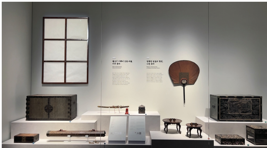
圖 5 更新後的展場，整合展示螺鈿、魚皮與玳瑁等相關物件，層次分明地介紹取材於海的藝術文化。