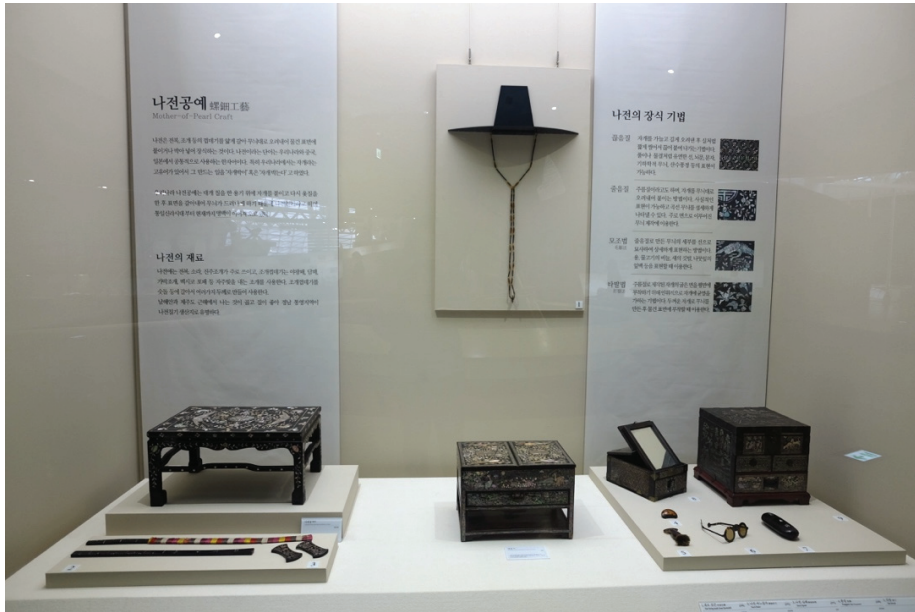
圖 4 過去以物件為導向的螺鈿工藝展區，與魚皮工藝等單元分列，較難察覺單元間的關聯。