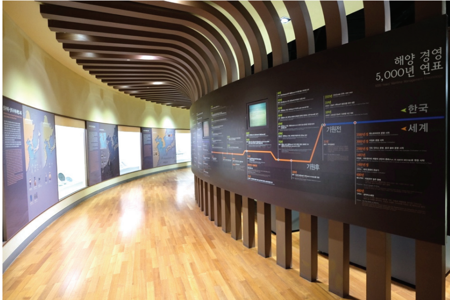
圖3 原常設展中富有多處年表、圖表，資訊量爆炸。

「藝術中的海洋」除了展示藝術品與工藝品，同時也藉由文化內涵與材質取用等面向，多元地闡述海洋與人的關係。展區中除了描繪海與人類海洋活動的畫作，同時透過繪有海洋相關神話動物龍紋飾的物件，取自魚皮、貝殼、玳瑁等材質製作的工藝精品，帶出了海洋與人深刻、多樣的關聯。