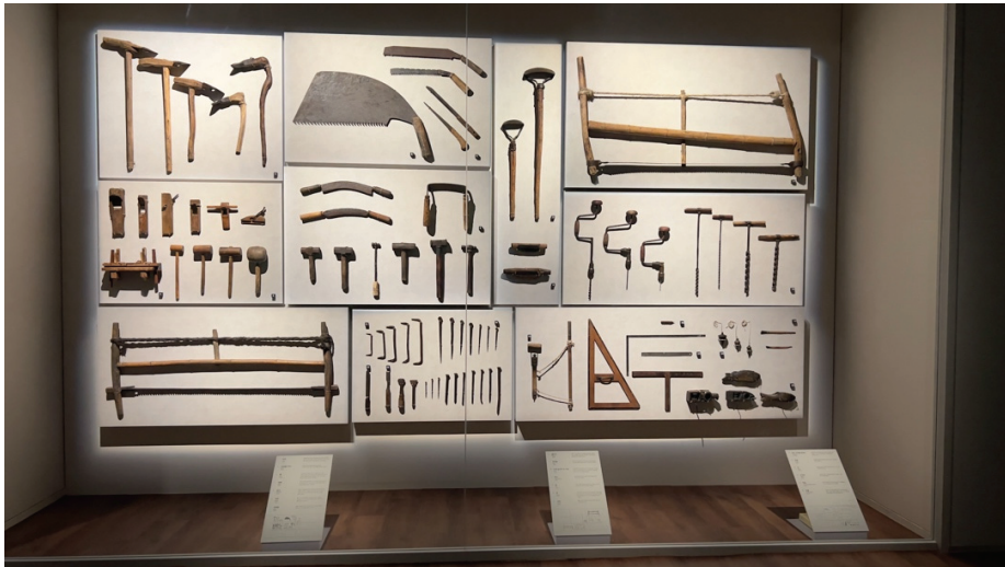
圖 7 同類型、主題物件集中展示，可以輕易比對其變化，視覺上也更美觀。

順序，展示觀看順序與脈絡也更清晰。因為做了這樣的調整，不僅讓出了更多可用於休憩、沈浸的空間（如圖 8），新常設展展出物件甚至不減反增，加入了 500 多件東、西方海洋文化相關物件。