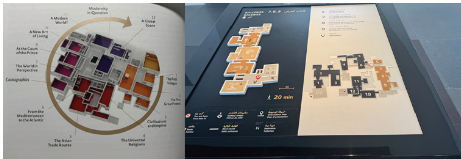
圖六（左）：世界文化史的 12 章節主題以逆時針環繞貫通整館 25 展間（Abu Dhabi Louvre, 2018:22）；圖七（右）：為現場的導引解說版，每一翼有三章節主題，標示參觀腳程，服務設施洗手間祈禱室休息處等資訊。（作者拍攝於 2025 年 4 月）

展覽空間整體仍為白色方塊氛圍，但不同於傳統大英博物館與羅浮宮博物館的展場，室內設計以玻璃鑲細金或黑框的大型透明展櫃呈現（圖四），或讓大型雕塑家具展品開放展示而不用玻璃櫃，一方面擴增展場空間，一方面回應人類學博物館的幽暗落後文明與櫥櫃展示的他者化後殖民質疑，讓展品透明直接與觀者互動，此展示設計也讓不同文明的選品，如美術館的雕塑般，在展間並置對話展演。全部十二個主題場館可從頭到尾連成一氣參觀，如歐美普世博物館的企圖，以四翼（wings）來規劃展館安排（圖六）。