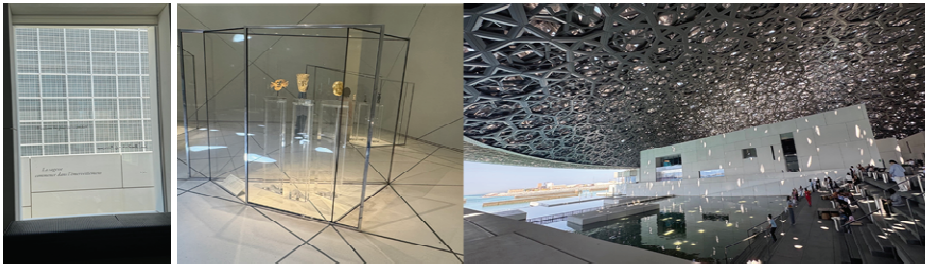
圖三（左）：窗櫺上的法文英文阿拉伯詩歌格言；圖四（中）：總論展間的星羅棋布玻璃櫃展示，以不同文化的面具文化比較展示；圖五（右）：博物館中介空間，穹頂光雨淋漓，面海舞台設計

全部的二十三個展館分為十二個主題章節（chapters）展間，本文接下來將以空間文本分析法來分析，參考官方導覽指南，媒體報導與筆者的參訪觀察，考量博物館建築的室內建築與展覽呈現，也同時分析此普世博物館的文化呈現政治。其以法國與阿拉伯聯合大公國當地的收藏呈現，以中東為主體開展的世界想像，筆者作為亞洲分析者也不免較重視與亞洲文物相關的文化對話。