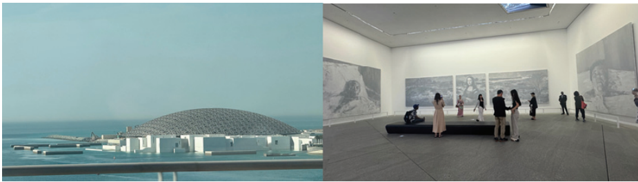
圖一：浮在海上的阿布達比羅浮宮；圖二：華裔藝術家嚴培明的作品蒙娜麗莎的喪禮

意義 9 （圖二），此原為羅浮宮的收藏，置此穿廊也間接連結了羅浮宮與阿布達比羅浮宮分館，以及其間的跨文化當代轉譯意涵。