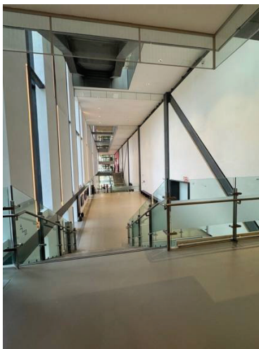
圖三 4B 展間望彼端 4A 展間(研究者拍攝)