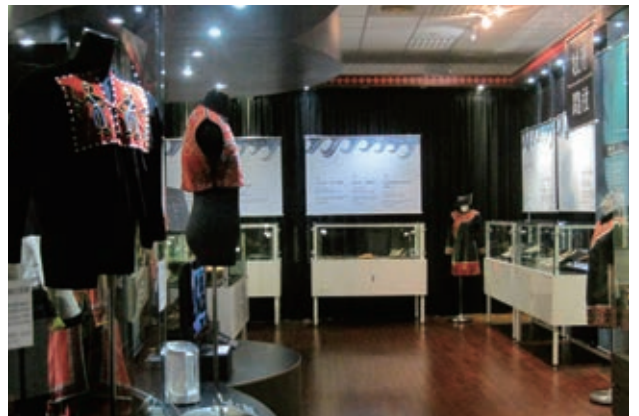
vuvu 的衣飾情特展展區