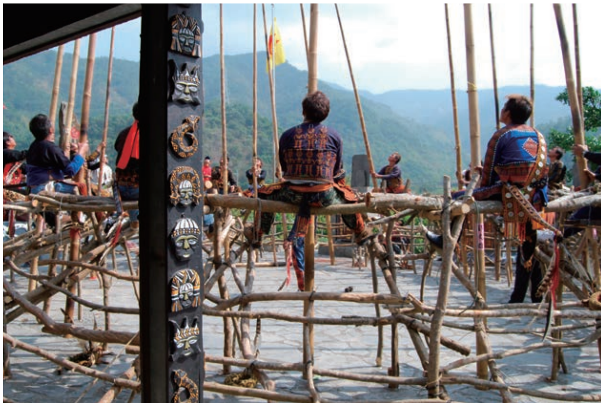
田野紀錄部落重要祭典 maljeveq