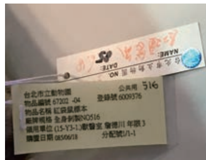
圖 2 紅頭袋鼠標本和牠的財產登錄名牌