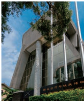
順益台灣原住民博物館外觀

各種有利資源，創造互惠效益，以獲得整體的成果。博物館界的資源整合需要透過產、官、學、媒通力合作，才能達到預期效益。