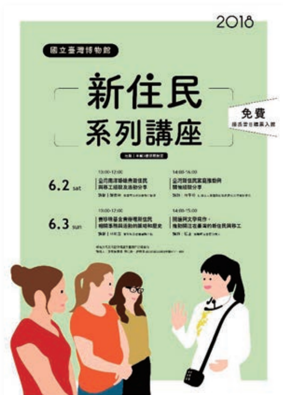
活動海報。臺博館官網 / 下載