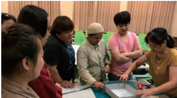
無酸保存紙盒製作教學與實作

條件下，以族群歷史與文化保存工作為己任，同時兼具展示策劃、田野調查、影像記錄、蒐藏維護、標本登錄建檔、清潔管理、活動推廣、文創開發、網頁行銷、補助申請或觀眾服務等多種角色。此外，執行輔導團隊十餘年來，在改善館舍運用、培力人才、提昇博專業能力等多方面的諄諄敦促和協助，亦功不唐捐。