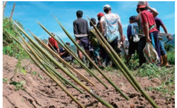
「奇美文物回奇美」後恢復失傳狩獵祭 Miadop， 圖為年齡階級挖壕溝插上倒插削尖箭竹圍獵

最後，我特別想要提出的是關於「文化翻譯者」角色的重要性。文化翻譯者不僅可以替部落發聲，並且在對內溝通、對外溝通、以及在很實際地方協作的過程中，都可以扮演相當關鍵的角色。以奇美原住民文物館與部落結合的經驗，奇美部落很幸運的擁有多位文化翻譯者，並且在實踐中不斷成長，以及再養成更多的文化翻譯者。文化翻譯者不一定要有世俗的學歷，每個文化翻譯者都可以用自己的方式來為部落做事，但重點是能夠合作整合，而不是分裂內耗。其實就連合作整合也可以有多種方式，不一定要套用什麼樣的模式。就我的觀察，在當代原住民族要改善自己的處境，文化翻譯者只會越來越重要。並且，全臺灣各部落與 29 個原住民地方文化館，能夠適切扮演文化翻譯者的人也越來越多。「文化翻譯者」如何細緻操作其實是個重要的課題，不過這就不是這篇文章可以充分訴說的了。