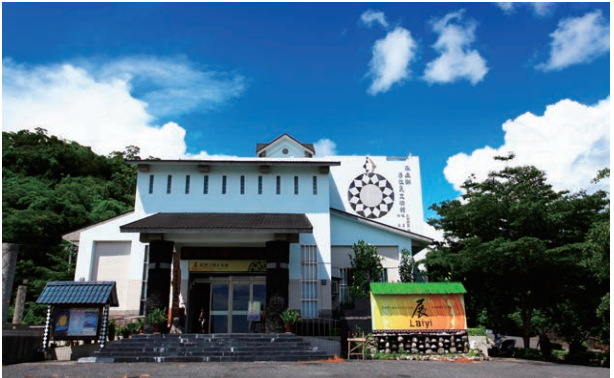
屏東縣來義鄉原住民文物館外觀