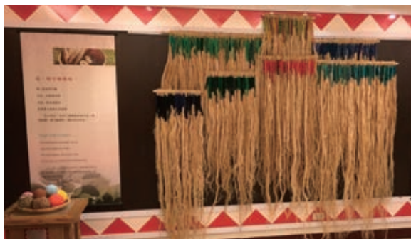
桃園市原住民族文化會館特展區