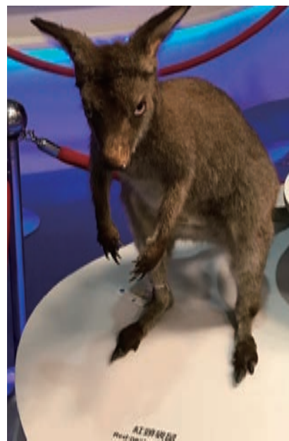
圖 3 紅頭袋鼠標本和牠的財產登錄名牌