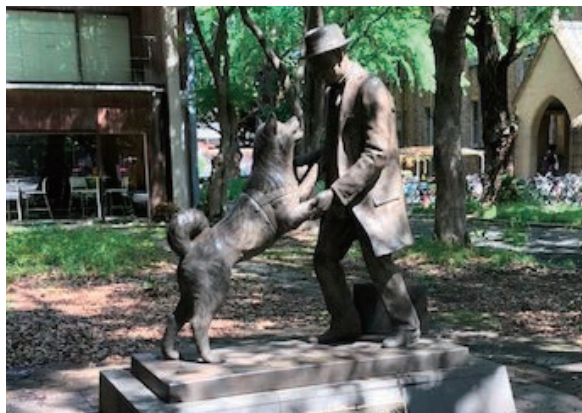
圖 5 東京大學中「忠犬」八公與主人重聚的塑像

今（2018）年 3 月結束的臺中自然科學博物館象群特展，曾展出林旺和馬蘭的骨骼標本，主題是「林旺馬蘭站起來」。之後展覽再移師臺灣博物館，在《小心！象出沒！》象群特展中，同台展出林旺、阿沛與馬蘭的骨骼標本。