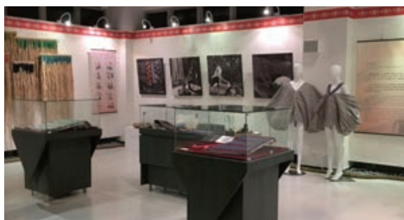
苗栗縣泰雅文物館特展區