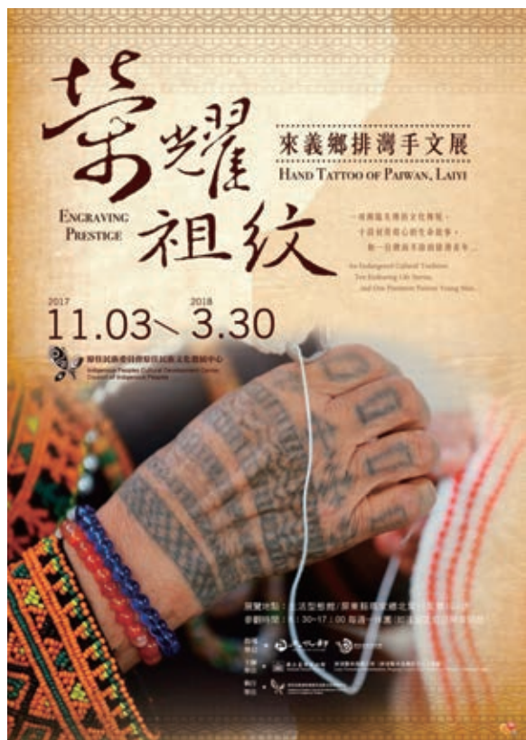
來義鄉排灣手文展海報