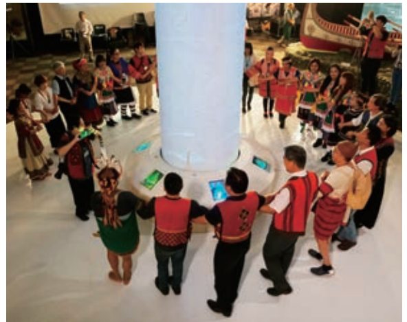
在「我們都是一家人」四步舞歌聲中，原文發中心和科博館完成締盟儀式。

晚近有幸參與原文發中心主政的「全國原住民族地方文化館活化營運及專業升級計畫」，隨同中心長官、李莎莉館長、周明先生和諸多專家學者，走訪各地方