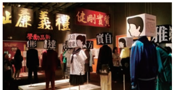
安排與會者國立臺灣歷史博物館《上學去：臺灣近代教育特展》。