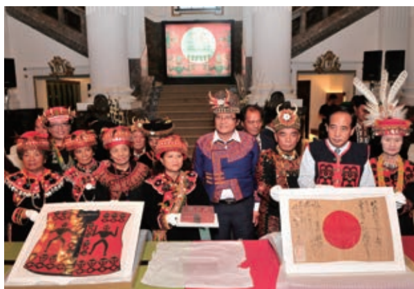
遙吟特展在臺博館舉辦啟運記者會