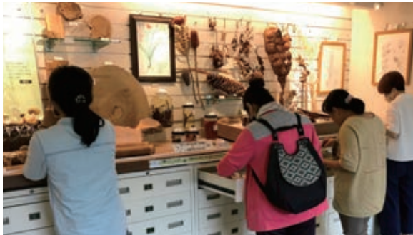
自然學友之家動手體驗