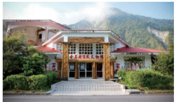
奇美原住民文物館正面