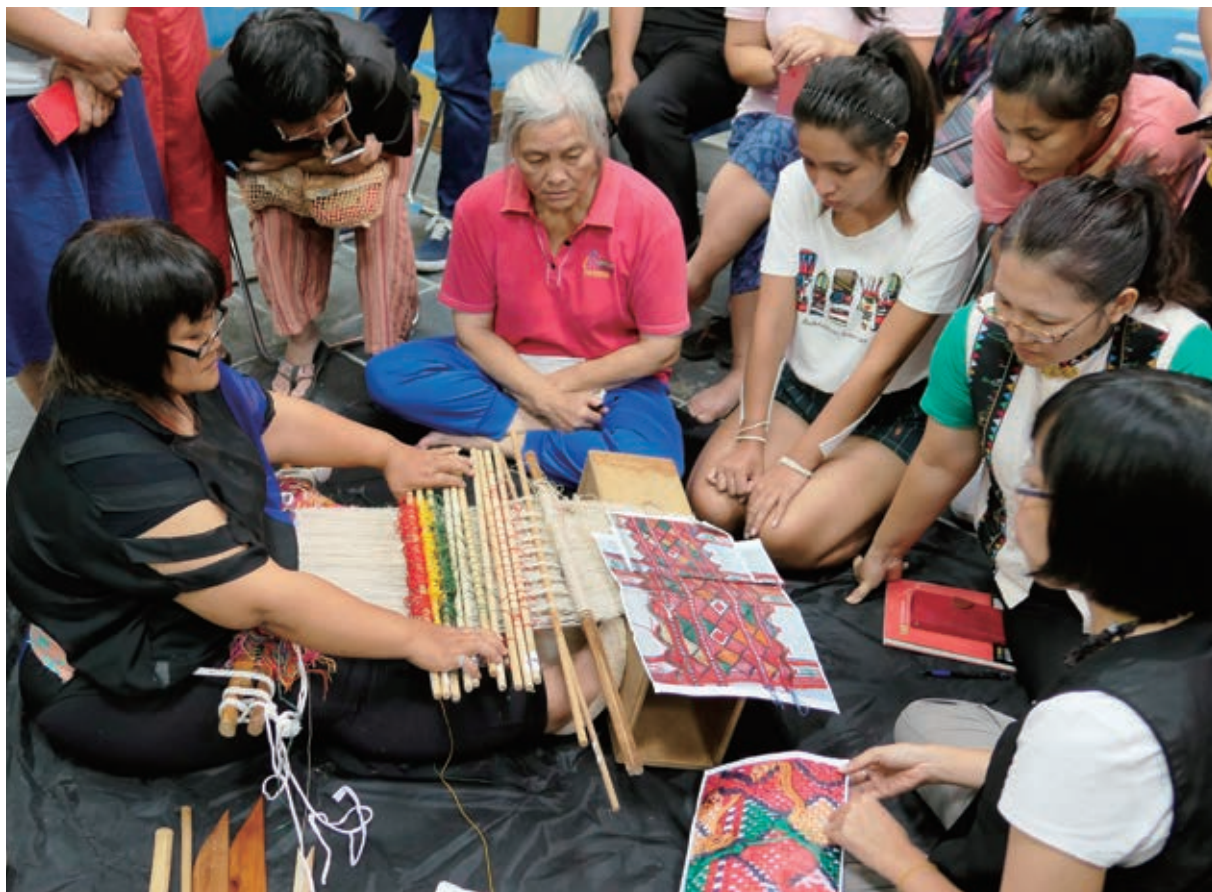
海端鄉傳統地機織布研習課程