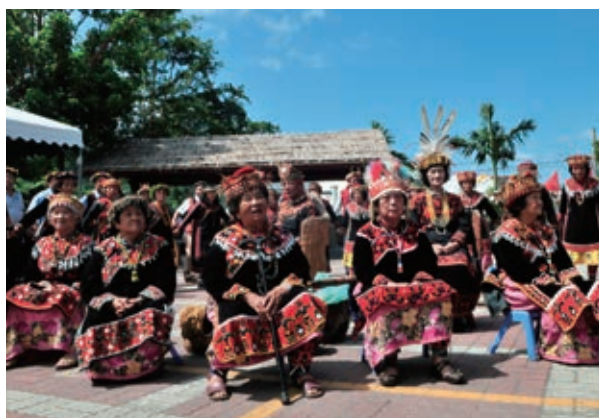
族人穿著盛裝在遙吟特展開幕儀式上表演