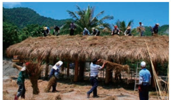
奇美部落營造從蓋兩間茅草屋開始