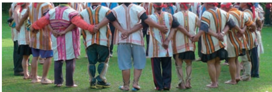
布農族八部合音。

專業人力計畫，透過文化發展中心進行聘任與管理，增派人力至各地原住民族文化館服務，同時採取文化發展中心和地方政府共同管理的機制，確保專業人力具有長期性工作方針之餘也能應符地方政府委派事宜。在專業智識的培育上，則藉由定期授課、區域性工作坊以及館舍間互助交流等模式，強化專業發展和合作管道，讓過往的輔導與評鑑，逐漸以陪伴協助和合作精進取代。若以樂觀角度來說，這項政策或將逐步建立原住民族文化館工作者的向心力與專業自信，同時及時藉由文物典藏維護、文物資產調查以及展示與推廣教育，拓展對博物館事務有興趣的觀眾與服務者，屆時，該政策亦可期盼人力逐步穩定且能力日益深化之後，原住民族文化館的工作者能為日後館務治理與社群文化發展帶來助益，進而摸索出適合在地脈絡與發展需求的治理發展模式。若審慎視之，這項政策是否能紮實在實踐原住民族權利的基礎下，培育出文化事務專業人才、帶動原住民族觀點的文化資產論述出現並且保存與再現具備原住民族觀點的智識與文物，仍有待相關論點的傳遞、有志者的持續投入與政策制度的常態檢視。