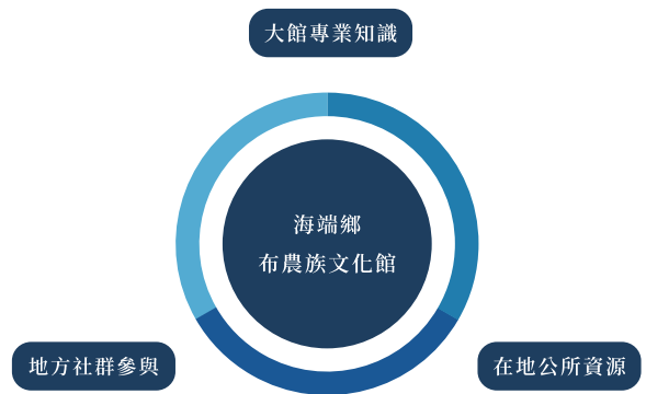
海端館資源整合示意圖

海端館在上述發展脈絡中，也曾嘗試各項資源整合策略的行動。原住民族委員會自 2007 年便開始持續推動「地方原住民族文化館活化計畫」，其中「大館帶小館」方案，藉由導入大型博物館的專業知識與資源，增加與培植地方館經營者在博物館相關專業知能的能量。例如海端館於 2008 年與國立臺灣史前文化博物館（以下簡稱史前館）合作的《Taupas·日本軍：南洋軍伙回憶錄》展覽（以下簡稱 Taupas 展），和 2015 年與國立臺灣博物館（以下簡稱臺博館）合作的《kulumah in 回家了！：臺博館海端鄉布農族百年文物返鄉特展》（以下簡稱百年文物展），以及 2017 年在史前館協助下開展的海端館典藏庫房重整與文物