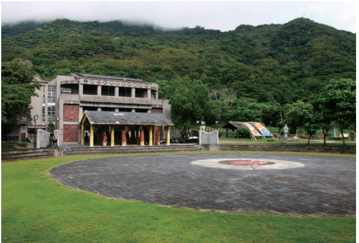
海端鄉布農族文化館景觀