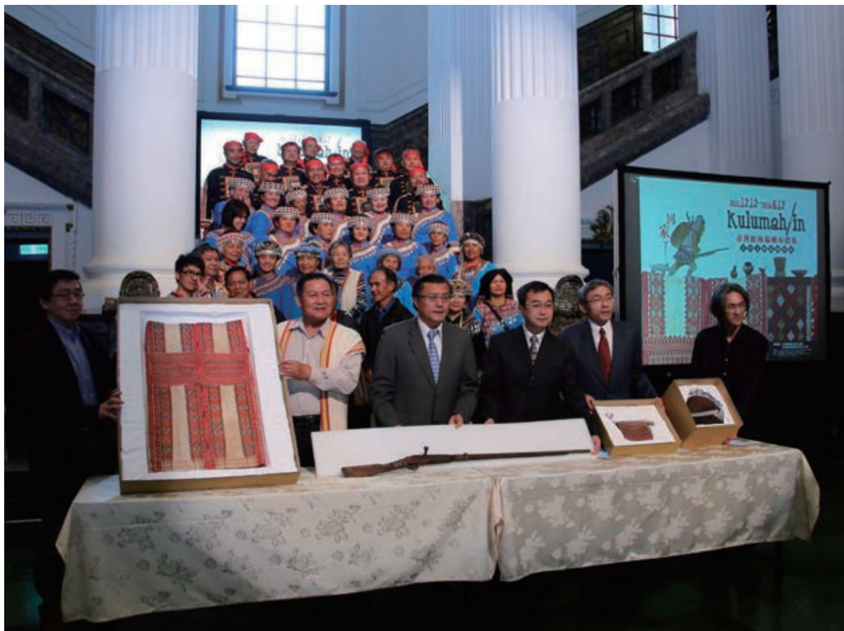
《kulumah in 回家了! : 臺博館海端鄉布農族百年文物返鄉特展》啟運儀式

2 資料參考來源: 李子寧, 〈從「民族誌物件」到「文化資產」- 臺博館藏原住民文物「返鄉」意義的探討〉, 發表於 2014 年 10 月 30 日 2014 第六屆博物館研究國際雙年學術研討會—文化與自然遺產的復原與回春: 博物館學的透視。