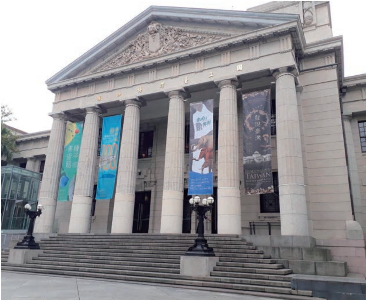
國立臺灣博物館外觀