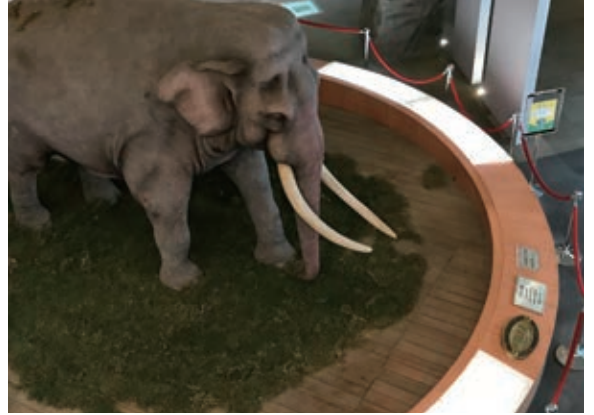
圖 4 透過展示林旺的剝製標本，人們的歷史也被重新詮釋

軍的方式徒步千里返國。勝利後擔任興建「抗戰烈士紀念碑」的工作，並順利達成募款表演。