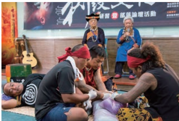
來義鄉排灣族刺紋文化研習暨部落論壇活動