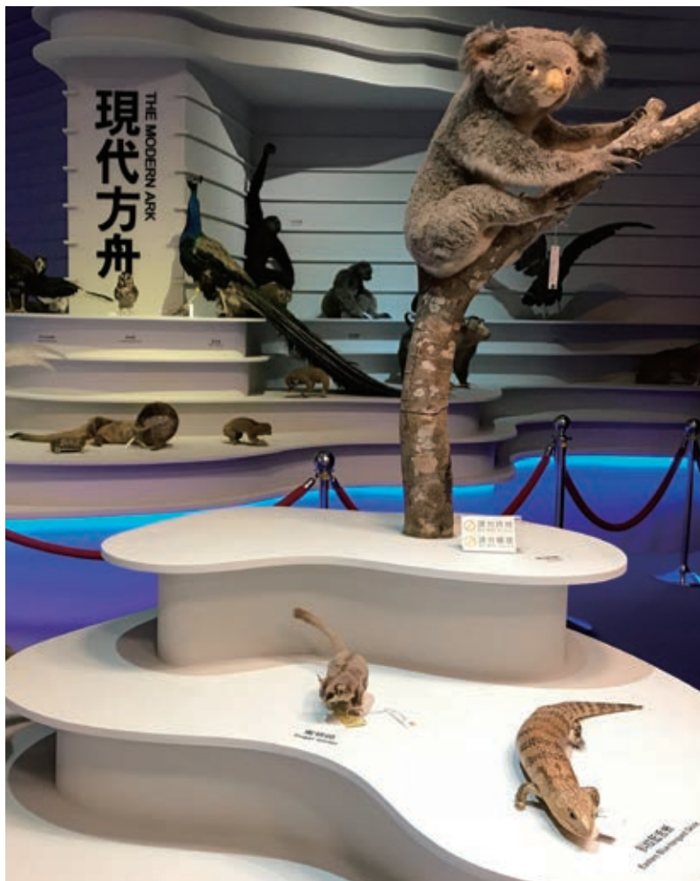
圖 1 臺北動物園教育中心標本展示區

1 本文之撰寫，感謝紐西蘭坎特伯里大學文化研究博士生龔玉玲在觀念及資料上提供啟發與協助。