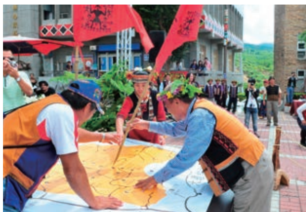
遙吟特展開幕儀式，頭目授旗代為管理者並將屬