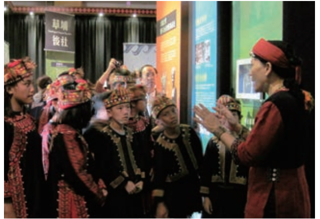
vuvu 的衣飾情特展開幕導覽