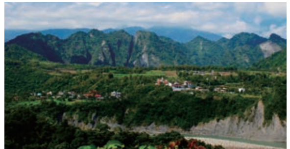
眺望奇美部落景，可清楚看到上部落、下部落

回顧奇美原住民文物館的實踐，最特殊之處就屬博物館與部落營造一體兩面的結合，而這與奇美原住民文物館脫離蚊子館的歷史有關，使得奇美部落團隊得以以委外管理方式取得更大的自主空間。奇美原住民文物館2004年竣工後撥付給花蓮縣瑞穗鄉公所管理，隨即就因公所無相關的配套措施變成了「蚊子館」。在奇美原住民文物館大門深鎖的同時，2005年奇美部落族人從蓋兩間傳統茅屋開始啟動了部落營造，而兩間茅屋就蓋於當時還是蚊子館的奇美原住民文物館旁邊。2006年茅屋蓋好後，由於部落幹部討論想要活化茅屋周邊土