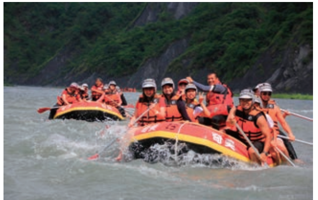
奇美部落文化泛舟