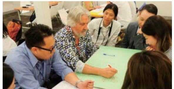
博物館人權展示與教育工作坊。

教育對於博物館功能及民眾參與皆扮演了重要角色，期待透過系列活動環環相扣的議題，凝聚更多博物館人之於教育的關懷與行動，共同思索新時代下博物館教育之功能與角色。