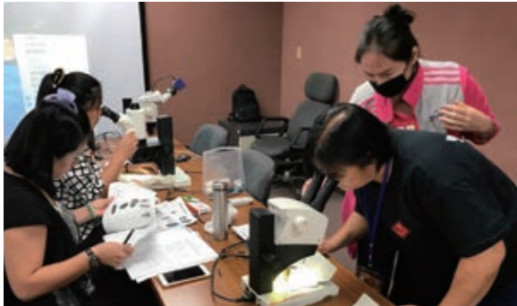
觀察和記錄各自館所捕蟲盒內的採集成果