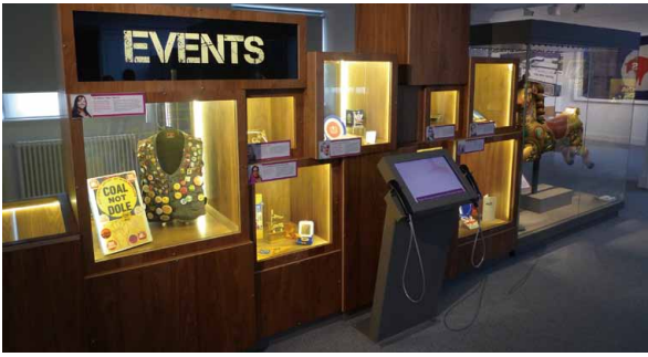
圖 9 伯明罕市民的故事及其物件展覽（一）