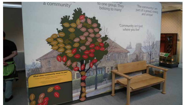
圖 7 What does community mean to you

透過地圖、旅遊手冊與尋幽訪勝這類的活動，觀眾得以很輕易地使用十八世紀旅遊書來探索城市的過去，如果你是伯明罕市民，你更可以運用自身的回憶與親身經驗去體察這個城市地景的變化過程。以市民為主要社群對象的展示，讓市民在參觀的過程中得以打破作者、文本與讀者的權力結構，以貼近自身記憶與經驗的方式，讓城市的旅遊與探索變得更為有趣。此外，在展示的論述中使用地圖、建築景觀的古今變遷，也確實反映了英國史學界過去四十年來對於地方史（local history）與地景史（the history of landscape）的知識成果。（圖 6）