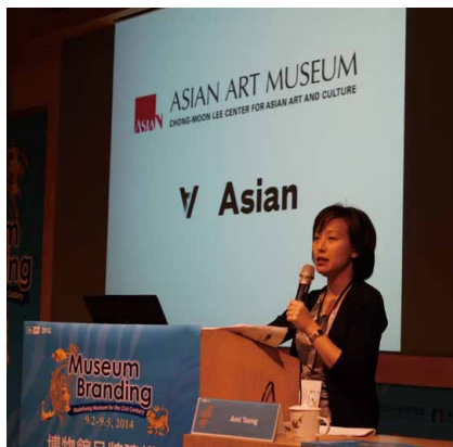
圖 4-1、4-2 國際博物館協會行銷與公關委員會 2014 臺灣年會 品牌個案研究論文發表