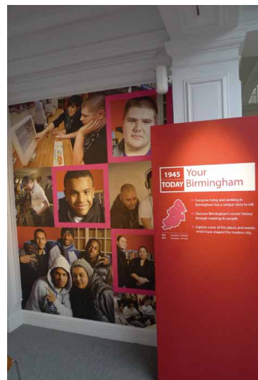
圖 8 Your Birmingham 1945 to Today 展區入口

其次要介紹的部份則是整個常設展的最後部分：「你的伯明罕 1945 年至今」（Your Birmingham 1945 to Today）。展區的簡介是這樣論述的：「每一個在伯明罕生活與工作的人都有獨特的故事可以談論。透過與這座城市的民衆碰面談話，我們挖掘伯明罕近年來的歷史。與我們一起探索曾經型塑這座城市的地點與事件。」 6 展區以伯明罕的民衆、生活與工作的地點以及發生在這座城市與其人民身上的事件為主題，運用口述歷史的方式，訪談並蒐集一般人民的故事，並將這些故事作為博物館歷史論述的一部分，用以架構伯明罕的城市史。當然，並不是所有人的故事都能進入博物館成為公眾展示的內容，其選擇的標準在於個別民衆是否能提供與其故事相關的藏品給博物館。也就是說，故事與藏品必須同時具備入藏的價值，而其價值不全然是藏品本身的價值，而是視此藏品是否能夠前後一致且和諧地置入博物