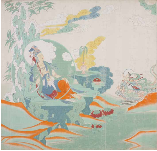
水月觀音 140.8 * 144.5 1941-1943