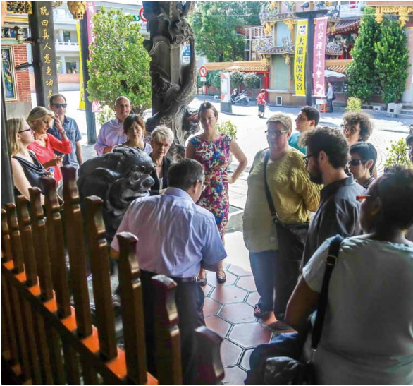
圖 14 國際博物館協會行銷與公關委員會 2014 臺灣年會 大龍峒保安宮參訪