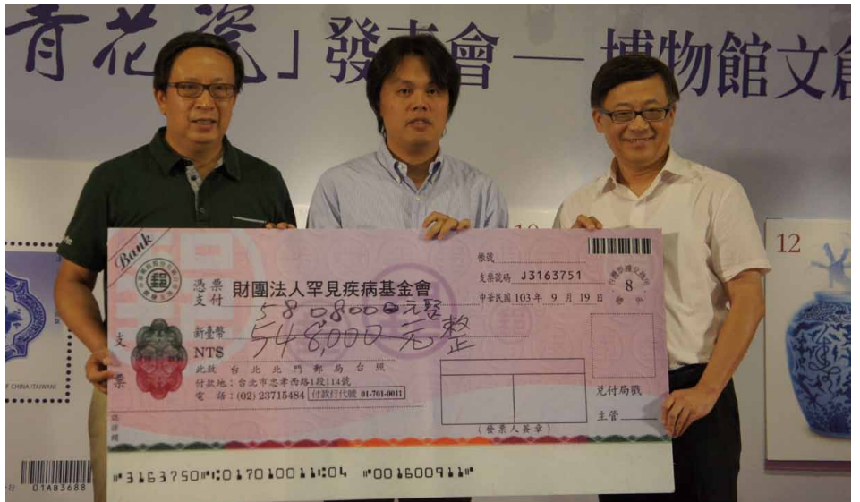
圖 2 青花瓷郵摺慈善義賣活動所得全數捐贈財團法人罕見疾病基金會以及財團法人育成社會福利基金會等兩大公益團體