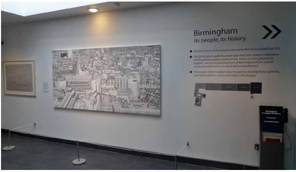
圖 2 展場入口