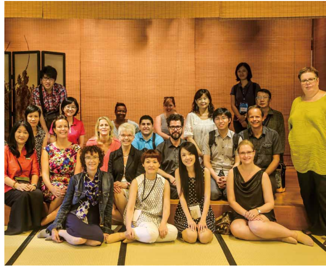
圖 15 國際博物館協會行銷與公關委員會 2014 臺灣年會 北投文物館參訪

立故宮博物院走訪馮明珠院長，進行博物館專業交流，並飽覽故宮文物精華。結束後前去順益台灣原住民博物館，認識臺灣原住民文化特色。晚間抵達隱居汐止山間的食養山房，體驗一場視覺與味蕾的饗宴。