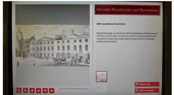
圖 6 建物資訊

道的內容，進入之後會看到十八世紀伯明罕的地圖以及景點位置，點選景點則會有景點介紹與相關說明。整個十八世紀 Stranger's Guide 的視覺化與數位化呈現像是使用導覽手冊或是 Google Map，身處二十一世紀的參觀者可以按照十八世紀旅人所提供的導覽手冊，像個初來乍到者一般興奮地探索十八世紀的伯明罕。透過導覽手冊，這個展覽希望觀眾能夠像旅行者或觀光客那樣去發現這個城市的「亮點」、產業發展，以及社交名人。（圖 4）（圖 5）