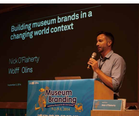
圖 5 國際博物館協會行銷與公關委員會 2014 臺灣年會 Nick O'Flaherty 進行專題演講