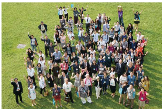
國際博物館協會行銷與公關委員會 (ICOM MPR) 2014 臺灣年會：9月2日-3日研討會與會人員合照。

佛光山佛陀紀念館「二〇一四年五大博物館首度聯合至佛館舉辦《七寶瑞光——中國南方佛教藝術展》」