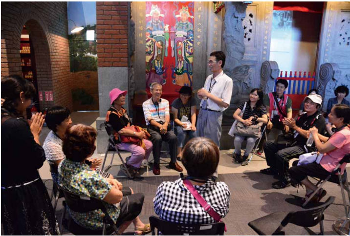
阿茲海默症 專案活動