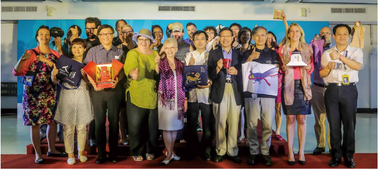
圖 17 國際博物館協會行銷與公關委員會 2014 臺灣年會 閉幕記者會國內外貴賓 Show Time 秀臺灣博物館文創商品