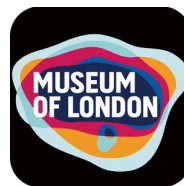
「Streetmuseum」 在 App 商店的 Logo