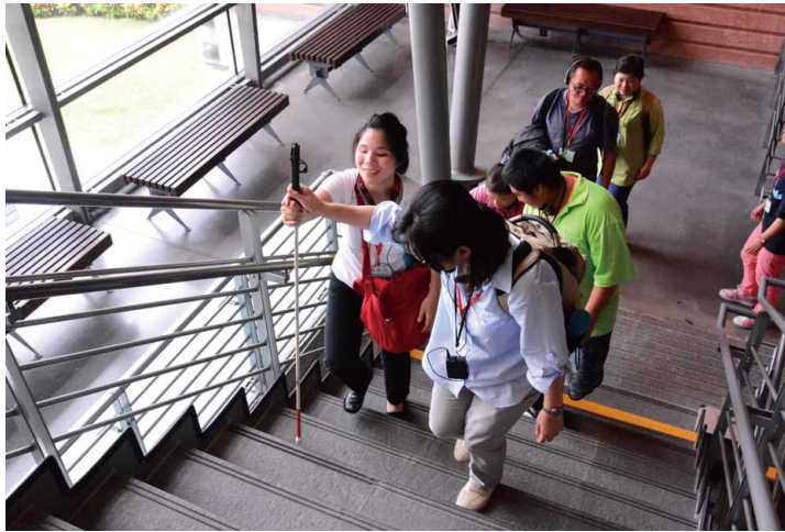
視障團體使用手杖，進行公共空間定向與移動的學習。