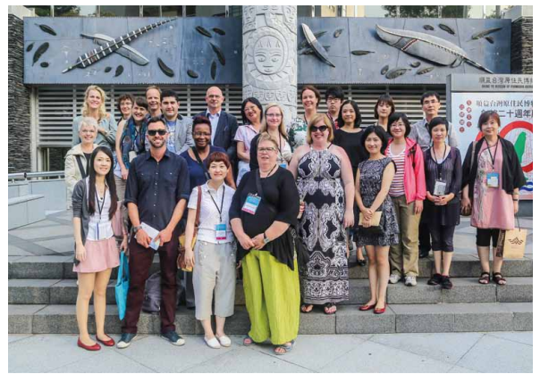
圖 12 國際博物館協會行銷與公關委員會 2014 臺灣年會 臺中市政府文化局好客晚宴錦集