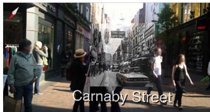
「Streetmuseum」內童截圖