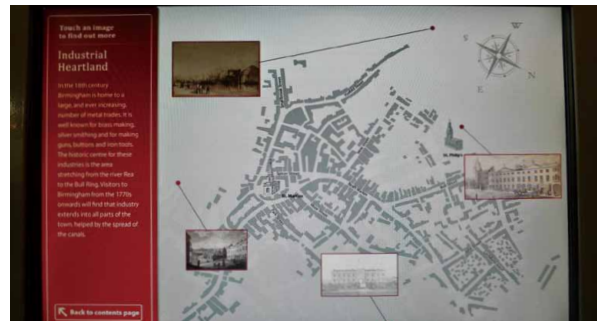
圖 5 地圖導覽以及建物地點標示

道的內容，進入之後會看到十八世紀伯明罕的地圖以及景點位置，點選景點則會有景點介紹與相關說明。整個十八世紀 Stranger's Guide 的視覺化與數位化呈現像是使用導覽手冊或是 Google Map，身處二十一世紀的參觀者可以按照十八世紀旅人所提供的導覽手冊，像個初來乍到者一般興奮地探索十八世紀的伯明罕。透過導覽手冊，這個展覽希望觀眾能夠像旅行者或觀光客那樣去發現這個城市的「亮點」、產業發展，以及社交名人。（圖 4）（圖 5）