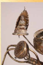
鑲嵌蓮花寶子形銀香爐