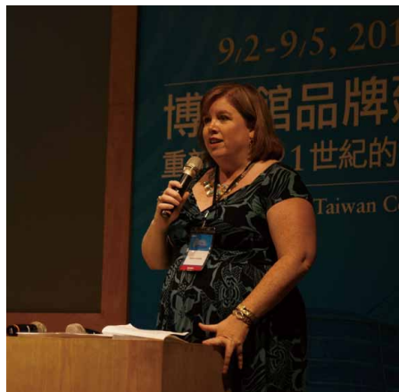
圖 9-1、9-2 國際博物館協會行銷與公關委員會 2014 臺灣年會 藉由洞悉觀眾打造品牌論文發表