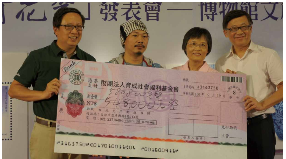
圖 3 青花瓷郵摺慈善義賣活動所得全數捐贈財團法人罕見疾病基金會以及財團法人育成社會福利基金會等兩大公益團體

摺上親筆簽名義賣以共襄盛舉。其中，發行編號首 10 號的 10 本郵摺，特於發表會現場進行慈善拍賣，獲得在座貴賓們踴躍參與愛心響應，短短 10 分鐘即募得善款新臺幣 116 萬餘元，再加上其餘 40 本簽名郵摺同步於網路義賣，本次活動相關所得將全數捐贈財團法人罕見疾病基金會以及財團法人育成社會福利基金會等兩大公益團體，具體達成博物館公益文創的目標！