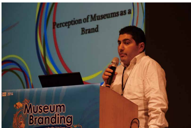
圖 10 國際博物館協會行銷與公關委員會 2014 臺灣年會 ICOM MPR 委員會理事 Hayk Mkrtchyan 說明 MPR 2015 年會將在阿美尼亞舉辦