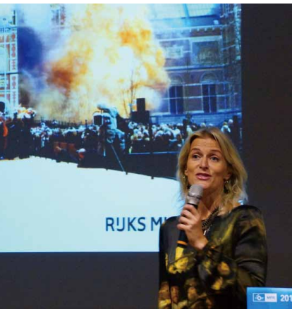
圖 8 國際博物館協會行銷與公關委員會 2014 臺灣年會 Marjolijn Meynen 進行專題演講