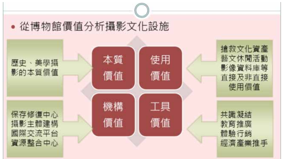
圖 2 攝影文化設施的博物館價值 (Scott, 2008; 文化部, 2013)

層面上。即使人們不參觀博物館，但仍然重視博物館的作用，因為它提供未來世代參與博物館、親近文化資產的選擇權。攝影作品與底片在臺灣面臨迅速毀壞的危機，目前三大美術館皆無典藏底片，而國內美術館面臨典藏庫房空間與設備不足的限制 5 ，加上國內攝影保存修復人才的缺乏，因此保存工作迫在眉睫。建議未來攝影中心以保存全民文化資產為使命，並擴大保存的廣度與深度，將攝影作品、底片、器材、文獻等皆納入保存的範圍。