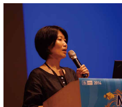
圖 7 國際博物館協會行銷與公關委員會 2014 臺灣年會 利用公共價值建立品牌論文發表