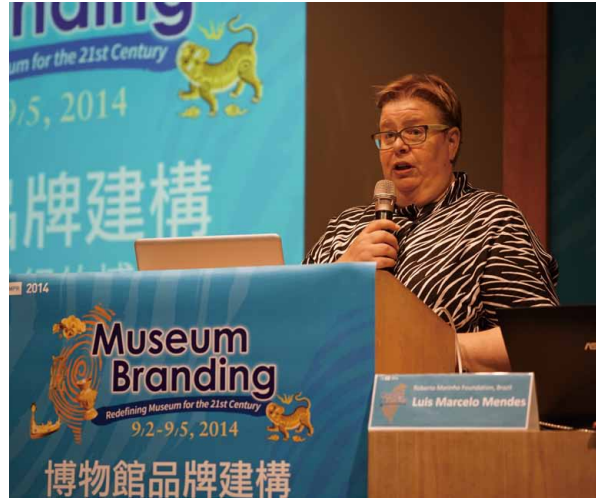
圖 2 國際博物館協會行銷與公關委員會 2014 臺灣年會 國際博物館協會行銷與公關委員會主席 Marjo-Riitta Saloniemi 開幕致詞