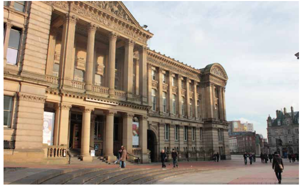
圖 1 Birmingham Museum & Art Gallery

在新興民族國家，尤其是後殖民社會，如臺灣、新加坡、南韓等，設立以展示國家民族歷史為主的國家博物館是建構國族認同的過程中相當重要的一環。生活在臺灣的我們很容易理解有所謂「歷史博物館」的存在，如臺北有國立歷史博物館、臺南有國立臺灣歷史博物館、臺東有國立臺灣史前文化博物館，國家歷史博物館與國家歷史的展示似乎是理所當然的結合。但是在博物館發展歷史悠久的英國，除了位於威爾斯卡地夫的聖凡剛斯國家歷史博物館（St.Fagans, National History Museum）介紹威爾斯人民的生活史以外，並沒有其他以「歷史博物館」為名的國家或城市博物館。如果要以博物館為學習歷史的場域，那麼英國的歷史在哪一間國家博物館可以看得到的呢？有沒有一套完整的講述英國國家歷史的博物館論述存在呢？本文所欲討論與介紹的展覽是位於英國伯明罕市伯明罕博物館暨美術館（Birmingham Museum & Art Gallery）中的常設展覽：「伯明罕：其民衆與歷史」（Birmingham: its people, its history）。以這個展覽的設計與論述為起點，我們可以發現在英國博物館中有一套與臺灣截然不同，解構的、由下而上的、權力下放的、點狀分布且去中心化的博物館歷史論述。（圖 1）