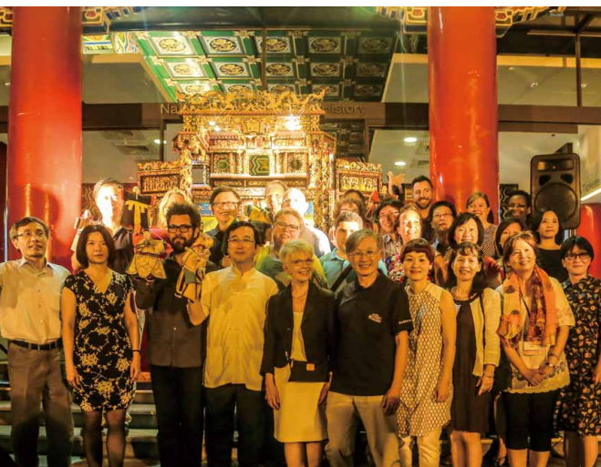
圖 18 國際博物館協會行銷與公關委員會 2014 臺灣年會 惜別晚宴年會圓滿落幕合影