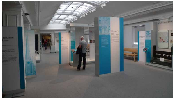
圖 3 展場空間

一方面經由閱讀博物館論述的過程，每一個個別的讀者會產生個別的對文本之解讀，並進而重新建構對自己有意義的論述。在這樣的意義下，讀者轉換身分變成博物館論述的作者以及自身故事的作者 4 。