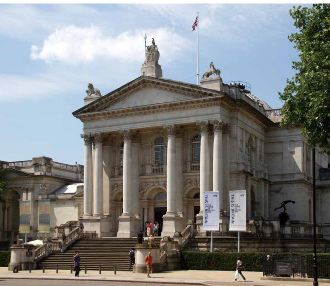
泰特博物館外觀

民眾可以在街上的特定地點打開「Streetmuseum」，搜尋倫敦博物館館藏中是否有該地點的照片或圖片，再透過地理定位與擴增實境的結合，將館藏的歷史照片及故事與現代的街景相互結合。倫敦博物館認為，這個 App 不僅僅是向大眾介紹博物館豐富的老照片收藏；更是一種運用生動有趣的界面，將博物館館藏結合大眾生活經驗的活動。（本刊訊）