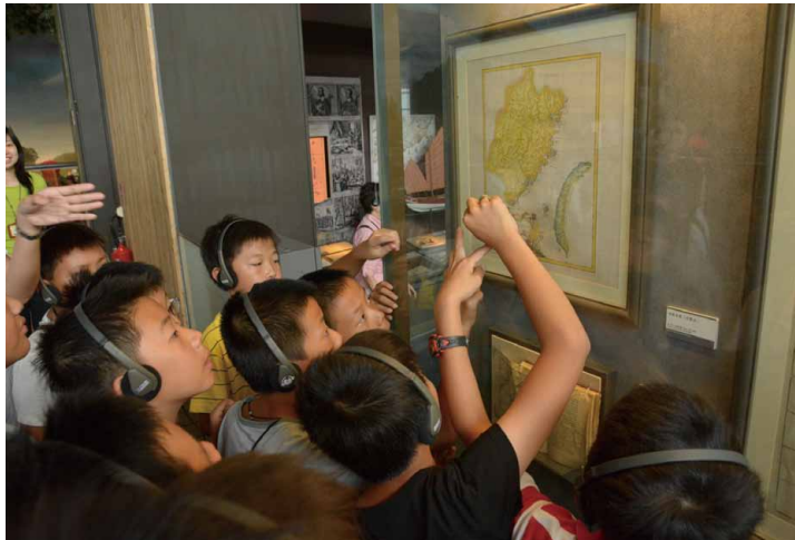
來自澎湖的學生在古地圖中發現家鄉

問： 能否請您談談貴博物館配合圓夢計畫的設施？您有在展館內規劃一塊適合特定障別的專區嗎？