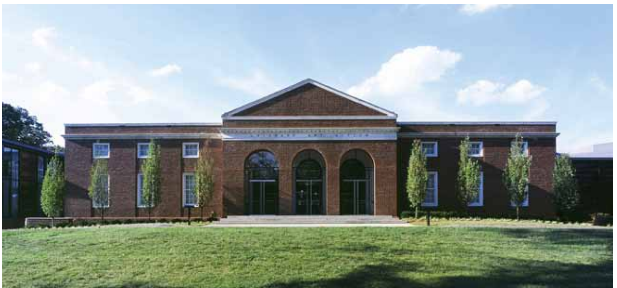
德拉瓦藝術博物館外觀

沙烏地阿拉伯旅遊文化局表示，拜訪該國的觀光客逐年增加；位於首都利雅德的沙烏地阿拉伯國家博物館的參觀人次，每年更是幾乎以倍數成長。藉由各種主題博物館的興建，當地政府希望能將該國的傳統文化以及現代發展介紹給全世界。該計劃並且承諾未來將會聘僱女性的博物館專家及館員，真正創造出新世紀的沙烏地阿拉伯博物館。（本刊訊）