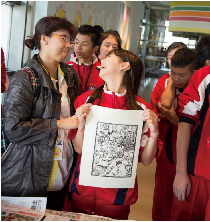
聽障學生參與 「臺灣 24 史版印說故事」 活動，完成版印作品