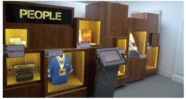
圖 10 伯明罕市民的故事及其物件展覽（二）