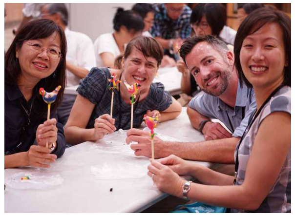
圖 11-1、11-2 國際博物館協會行銷與公關委員會 2014 臺灣年會 國立自然科學博物館歡迎晚宴錦集 (國立自然科學博物館 / ICOM MPR 2014 臺灣年會提供)