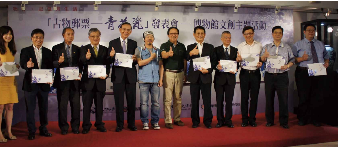
圖 1 「『古物郵票—青花瓷』發表會—博物館文創主題活動」現場慈善拍賣 10 本郵摺善款破百萬

當代博物館藏品不僅是相關學科的基礎研究標的，同時因其獨特的物質性，而被視為具有「加值」作用的文創產業。國立歷史博物館為響應本（2014）年度國際博物館協會（ICOM）年度議題－「以館藏創造連結」（“Museum collections make connections”），特以「物件與記憶」為主題，於本年 9 月份籌劃舉辦二場次「博物館文創主題系列活動」。