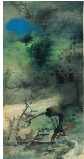
青綠潑墨山水 83.5 * 42.6cm 1965

吉林省博物院、四川博物院與國立歷史博物館是兩岸收藏張大千藝術作品的重鎮，藏品豐富且各具特色。吉林省博物院所藏多為張大千於1949年以前之作，反映出其畫學經歷和文人畫風嬗變過程。四川博物院所藏，除了其早期作品外，更有百餘件張大千於敦煌臨摹石窟壁畫之作，這些作品提供了追索其精麗巨構與重彩畫風轉變的重要軌跡。位於臺北的國立歷史博物館，則與晚年的張大千互動良好，不僅於海內外為其舉辦多次相關展覽，也收藏了張大千作品百餘件，其中多為旅歐時期所作，展現了其由成熟的寫意風格演變至潑墨潑彩的歷程。2013年適逢張大千辭世三十週年，兩岸合作策辦「萬里江山頻入夢——兩岸張大千辭世三十週年紀念展」，匯集了此三館所藏的張大千繪畫精品105組件，自2013年12月起至2014年11月止於深圳博物館、四川博物院、吉林省博物院與國立歷史博物館巡迴展出，不僅為兩岸觀眾呈現了張大千早中晚期不同階段的繪畫風貌，也藉此凸顯了兩岸博物館張大千藝術收藏的各異特色。