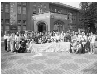
參訪成大博物館

整個年會的籌備，從事前規劃到現場服務，千頭萬緒的工作及時程掌握，環環相扣馬虎不得，由於是工博館第一次籌備此類型的國際會議，只能藉由不斷摸索學習成長，所有籌備工作皆由館內同仁親自包辦，其中包括會議主題的規劃、經費募款、國際論文徵稿、議程安排及英文會議文件的撰稿，與專題講者、投稿者及與會人員的電子郵件聯繫等，必須巨細靡遺追蹤管控，以利所有參加人員掌握及時資訊及做好發表及與會的準備。本次會議共吸引約120位來自13個國家及地區的科学中心或博物館的館長及專家與會，包括3場針對會議主題的專題演講，11場分組研討共有37篇論文及博物館實務經驗的發表，由各館長輪番上陣即席回應的CEO論壇，館內參訪包括蒐藏庫房、樂活節能屋及展示廳、以台灣為主題的大銀幕電影欣賞、科學演示，館外參訪行程包