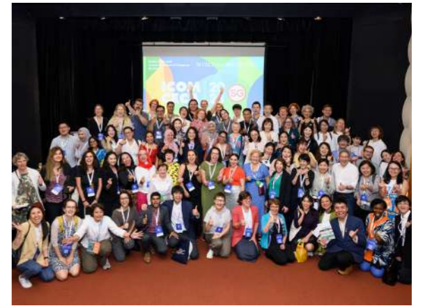
ICOM CECA 2023 年會開幕大合照

2024 年起，筆者擔任 CECA 在臺灣的聯絡人，此後將積極連結所有參與 CECA 的機構會員與個人會員，可以更有效率地將 CECA 的共學活動訊息，傳遞給國內的會員夥伴們。目前 CECA 亞洲區域委員會，是由新加坡擔任召集並推動運作，並且在馬來西亞、韓國和臺灣皆有聯絡人，2024 年亦將展開亞洲區域委員會的運作。並期待接下來在亞洲招募來自印尼、菲律賓和泰國的聯絡人。此外，臺灣與新加坡都是博物館教育與文化行動最佳實踐獎的常勝軍，未來或許可以舉辦得獎案例分享活動，藉此提升整體博物館教育活動的內容規劃與執行品質。