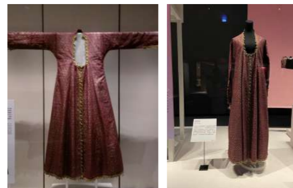
圖 7 展示效果 人檯 VS 支架