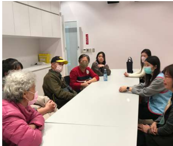
圖 6 服務對象的珍貴回饋是團隊精進的指引。