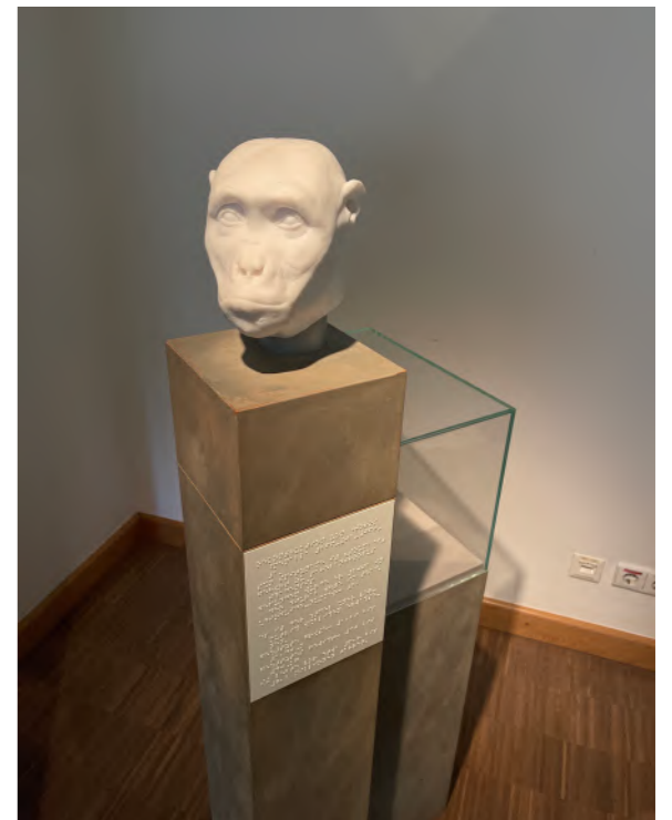
圖 1 森根堡自然博物館 (Senckenberg Naturmuseum) 人類演化展間的無障礙展件

行銷與教育在博物館教育推廣中經常被混淆卻也相輔相成。行銷與教育在學理基礎上有不同的定位和運用型態，但兩者皆因長期被定調為大眾與博物館產出結果的中介角色而常被放在最末端位置，也因此沒被完整思考分野與整合的最佳策略。其實教育應該是一個更上位的思考，尤其在展覽策畫、藏品近用或脈絡詮釋等歷程，博物館都有教育的思考，國際博物館協會（ICOM）2024年定國際博物館日主題為「Museums for Education and Research」，除了揭櫫教育在博物館中被思考的重要性外，我們可進一步從過去定義博物館的脈絡中看到教育的軌跡。