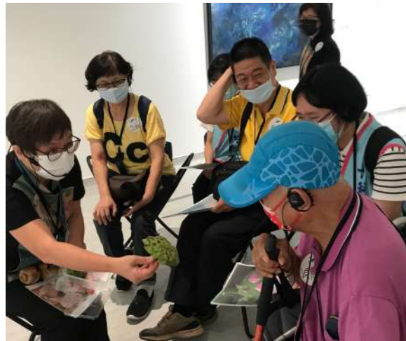
圖 5 在首場「友智藝同」藝術對談活動中，帶領者佐以實物讓服務對象透過觸覺與嗅覺認識作品身入其境。