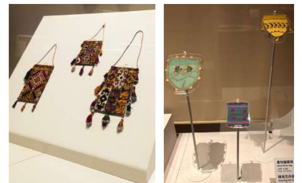
圖 8 展示呈現 墩座 VS 壓克力