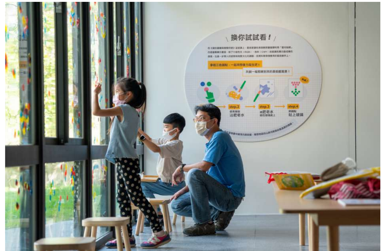
圖 5 「三角關係」展覽以「資訊圖像與視覺符號」課程概念出發邀請觀眾一起創作

在與協力對象合作之前，首先需先自問的是，為何我們需要「參與」、對象是誰、適當的方法是什麼、以及目標為何。進而需了解對方各自的特殊性，如文化差異、身心狀況、參與者願意投入的程度、合作所需相關知能差異程度等，因應對象不斷調整工作方式，並隨時檢討自身是否將專業知識凌駕於其他知識之上。建立夥伴關係的過程需要時間慢慢形成，找到博物館與對象的關聯性、練習换位思考、記得對方的能動性、創造安全包容的空間、維護彼此平等、自由且被尊重的表達、相互聆聽等都是過程中的重要方法。著眼的不仅是過程，更是其創造的意義，建構出屬於這個時代的我們所共同認可的博物館當代價值。