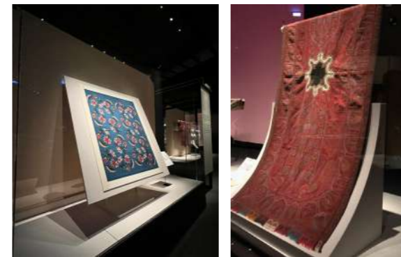
圖 5 展版模組化及視覺改良

本文由 111 年 9 月 23 日文資局舉辦「織事串流 -- 保 · 護 X 無設限」專業講座「織品文物的展示與保存—以國立故宮博物院典藏品為例」中擷取成文。