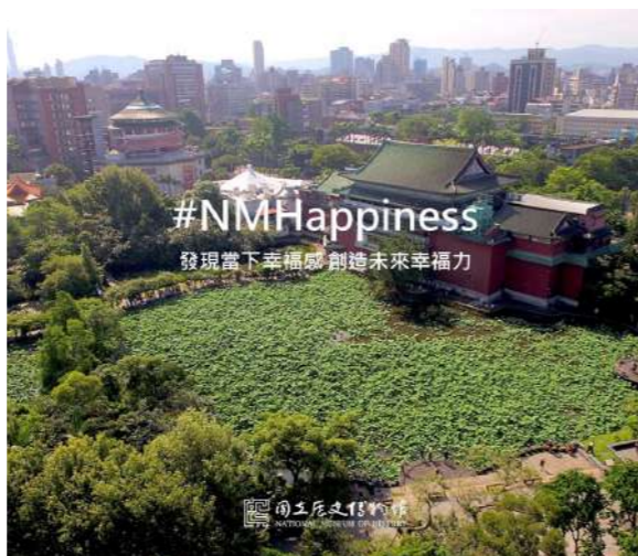
圖 7 史博館教育學習的價值品牌 NMHappiness

動的家庭和陪同者的回饋，如發現孩子的創意、引導孩子嘗試理解、學習觀察；認識史博館藏品；增加和他人互動等。並以開心、舒服、自在等字句形容感受，期待參與更多類似課程。