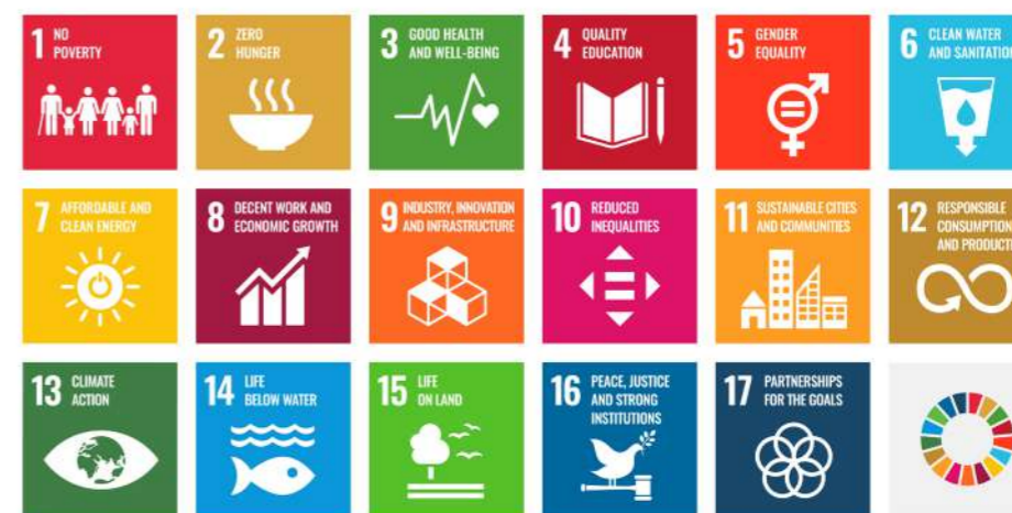
圖 1 聯合國教科文組織 2015 年提出的 17 項可持續發展目標。