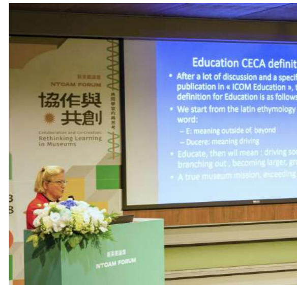
圖 1 2023 新美館論壇「協作與共創：共同學習的再思考」

新北市美術館 (以下簡稱新美館)「協作與共創—共同學習的在思考」論壇即在思考近年來美術館教育推廣計畫中常見「協作」、「共創」、「參與」等概念的引入如何為教育現場勾勒出新的面貌，並進而提問「當協作、參與作為方法，其對於教育現場的意義為何，又如何重塑美術館的知識生產路徑，回應多元社群的需求，更為積極地進入社會現實的脈動。」國際博物館協會教育與文化活動委員會 (ICOM Committee for Education and Cultural Action) 主席瑪希·克拉特·歐內 (Marie Clarte O' Neill) 於論壇中指出，「共創」是目前博物館界相當流行的字眼，如檢視 ICOM 於 2022 年修正的博物館定義，主要增加的關鍵字有：易近性、共融、多元、永續、社群參與、反思跟知識分享等，這些其實都是邁向「共創」的工作方法，且已經不是新的概念，昭示了這個年代博物館所欲推進的未來社會影響力。然而，就如同論壇副標題所示，在這股不斷推動的熱潮之下，我們應該先