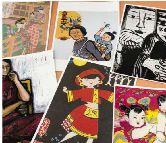
圖 5 由老師帶領從館藏認識臉的五官和表情