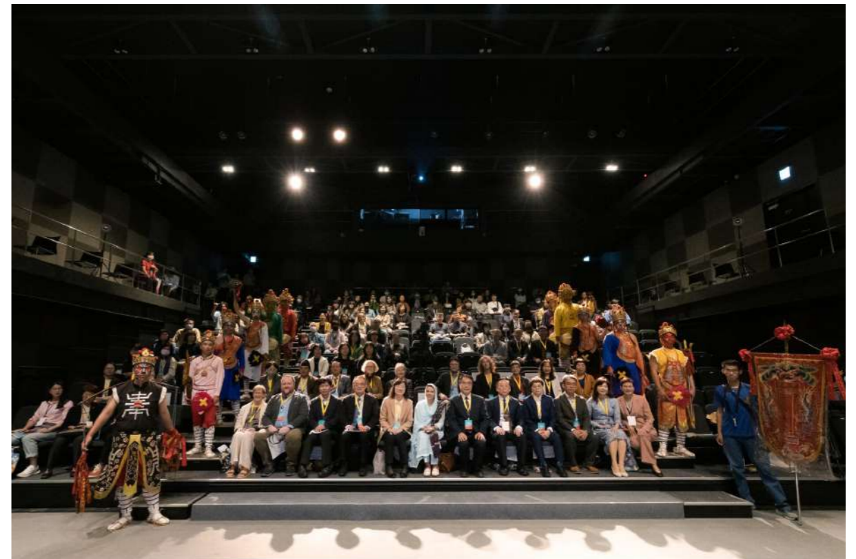
圖 1 ICOM-ICR 2023 臺南年會 開幕式合照