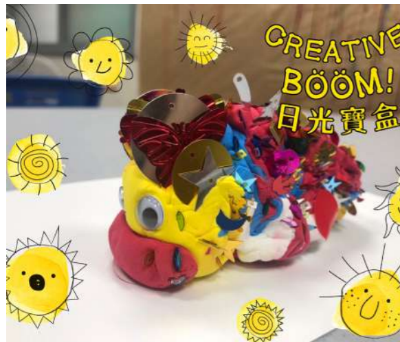
圖 4 「日光寶盒—世界怎麼了」智青參與者的用心創作