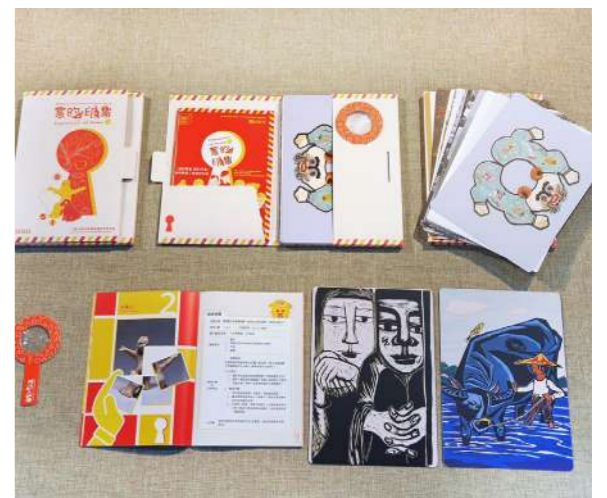
圖 2 優化的《創齡寶盒—長照專業人員應用手冊》提供專業者推動長者創意學習有力資源