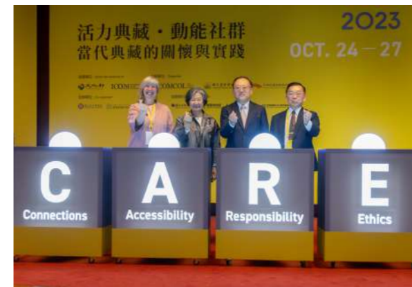
透過啟動儀式傳遞本屆 COMCOL 年會的核心精神「CARE」