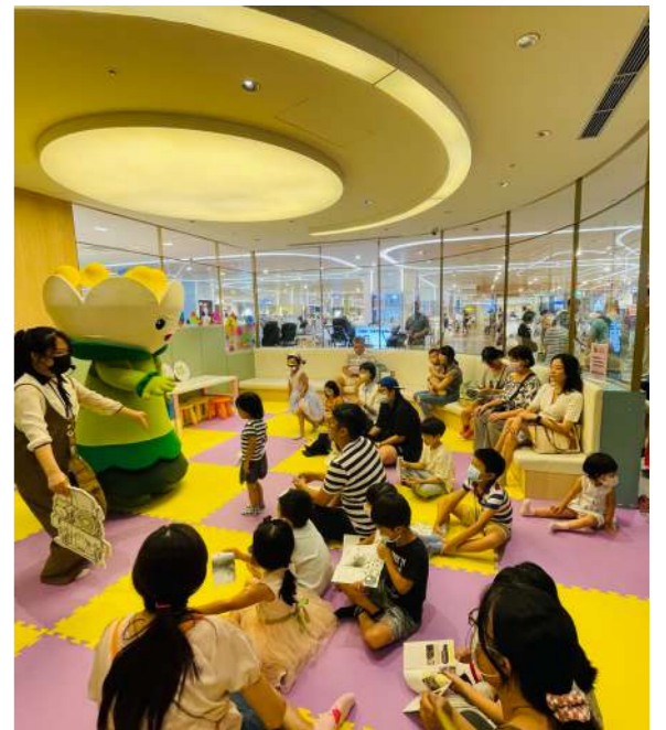
圖 2 國立臺灣博物館產製守護精靈結合教育內涵並至館外多方推廣

分眾教育在當代博物館教育中具有重要性，因此評量方法也應相對多元。不同對象的特定需求和學習風格應該被考慮進評估機制中，真正實現對個體差異的關注與鑑別。這種差異性的評估應當超越一般性的購票客群統計，深入了解並回應不同受眾的狀況和需求。博物館過去較偏向以總結性評量 (Summative Assessment) 4 評估，或以觀眾滿意度跟參觀人次評析，其實這都是片面的衡