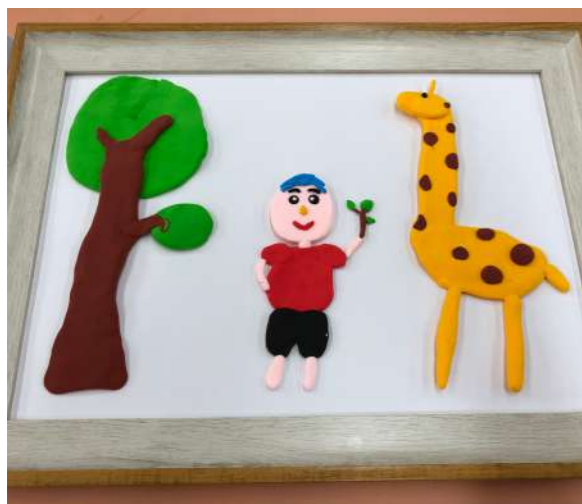
圖 6 自閉症小朋友和爸媽一起完成幸福的臉