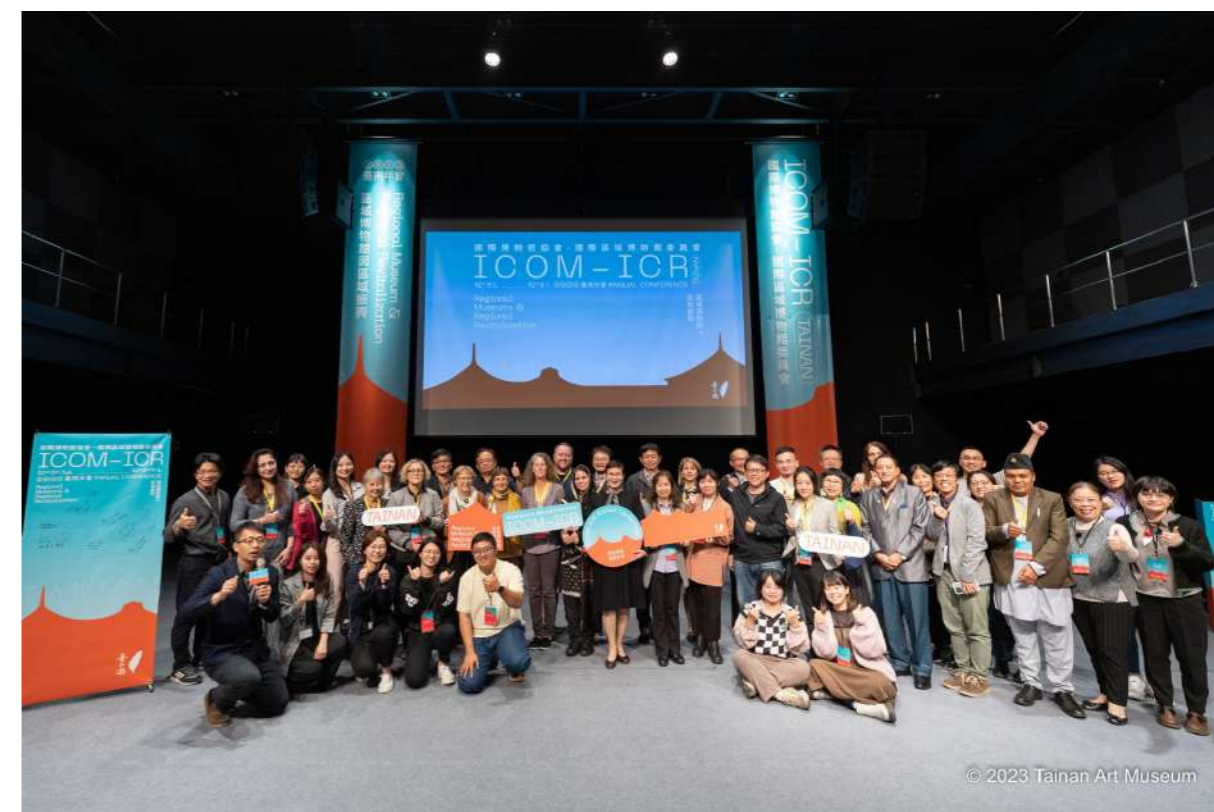
圖 2 ICOM-ICR 2023 臺南年會 ICR 理事會與全體論文發表者大合照

本次大會，國內發表的論文總括來看基本回應了文化部近二十年來推動「博物館與地方文化館發展計畫」的成果，其中超過 30 篇論文係來自各縣市公立區域博物館舍、民間館舍、臺東原住民文化館舍以及客家文化發展中心六堆客家文化園區等單位，國內博物館同仁非常踴躍投稿論文，發表分享來自臺灣在地的實踐經驗。期待今年 2024 年精選的年會論文集可以順利出版，讓成果得以留存及流傳。