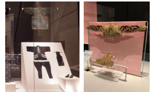
圖 6 群組展示