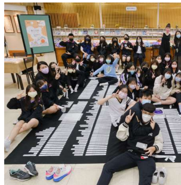
圖 3 鶯歌工商師生參與新美館「Inter net 數位足跡」 藝術教案開發計畫