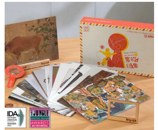
圖 1 「創齡寶盒 - 家的印象」長者創意學習資源的近用設計榮獲歐洲、美國等三項設計銀獎的肯定

在此，館藏超越既有知識脈絡，成為連結人的記憶和經驗的社交物件。接續針對長照及推動創齡的相關專業者規劃辦理培力課程，讓其認識這套博物館資源的應用；