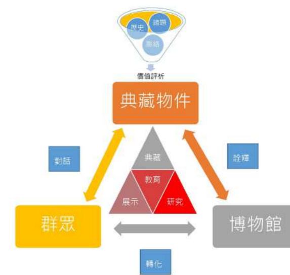
圖 4 本文歸納典藏、博物館、人之間連結關係圖，進而思考各向度的位置定位