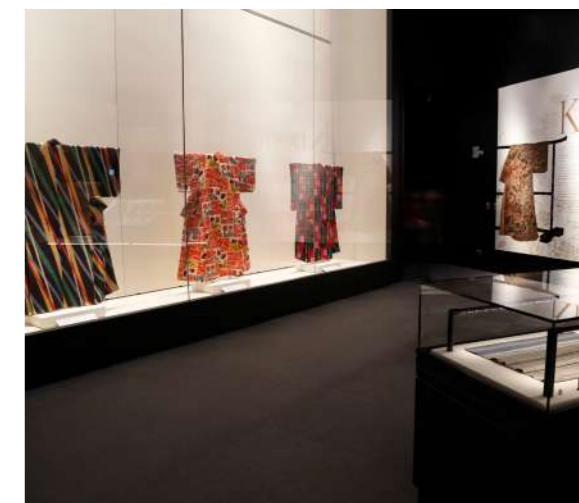
圖 2 展場照 II