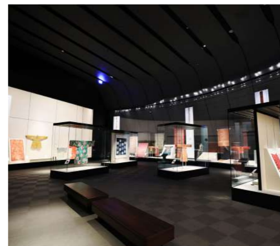
圖 1 展場照 I

展示手法在一次次的布展工作中，不間斷地嘗試與改進，例如考量觀眾視覺需求，原本垂直懸掛的布料，增加前端弧形的補助架後，觀者能更貼近展櫃玻璃，看清楚布料組織及紋樣細節。另外展示支架的永續使用，開發可拆卸的展示板、以及可調整角度的鐵件支架，展示板及展示支架可以自由組裝並重複使用，減少展示廢材。展件布展完成後，全體在空間上仍需要微調整，光影的影