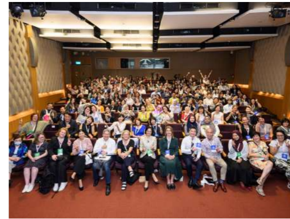
ICOM CECA 2023 年會研討會議圓滿完成

CECA 成立「異業結盟小組」(SIG) 鼓勵會員建立更頻繁的聯絡，共同反思全年進行的工作，不僅可增進彼此在參與實體年會的互動性，根據小組一年內的工作和交流情況聚焦討論主題，也可以彌補讓無法參加年會的成員，在平日透過線上參加 SIG 會議，在主題小組中充分討論，這些討論有助於協助會員評估博物館教育現場可能發生的挑戰，以及可以採取哪些應對作為。SIG 目前有 6 個主題小組，分別是：博物館教育工作者的專業發展、教育與文化行動觀眾接受度調查、數位參與及學習、共融博物館與全球易近性、博物館教育與去殖民化、感受與認知調節等。2024 年將新增第 7 個主題：永續發展與博物館教育。