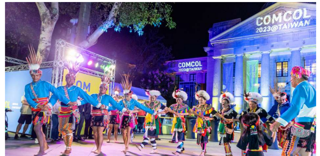
開幕晚會安排文化展演及體驗活動，展現臺灣在地多元文化