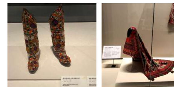
圖 4 立體支架