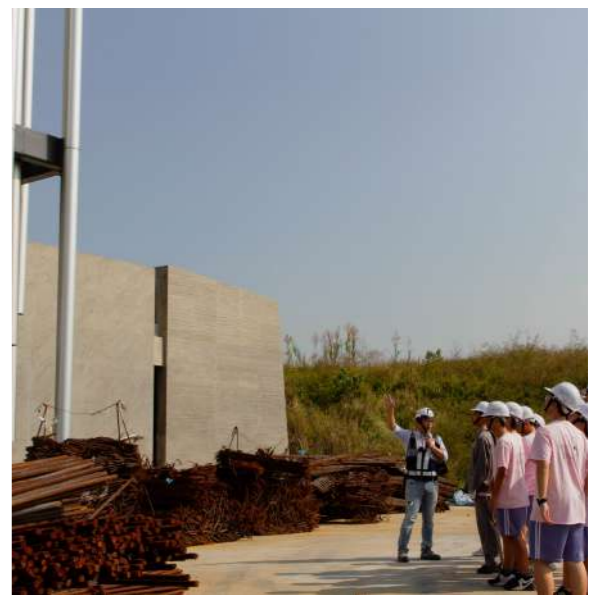
圖 4 三民高中參觀美術館工地並進行「一日美術館建築師」 工作坊創作