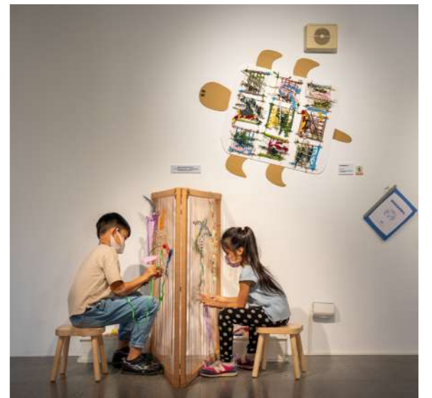
圖 2 「三角關係」展覽一隅呈現「編織龜龜爬山」教案成果