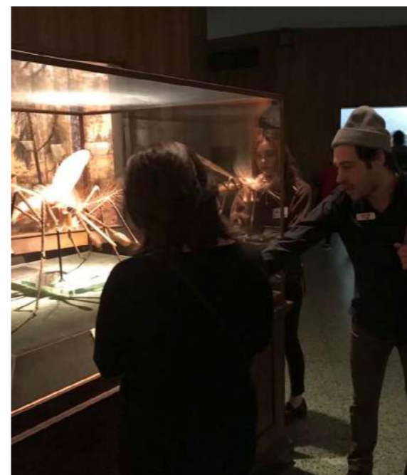
圖 3 美國自然史博物館 (American Museum of Natural History) 導覽活動設計參與者以他者視角觀看展品，可以透過參與者發表讓帶領者隨時評量參與者對於他者理解與發言內容精準性