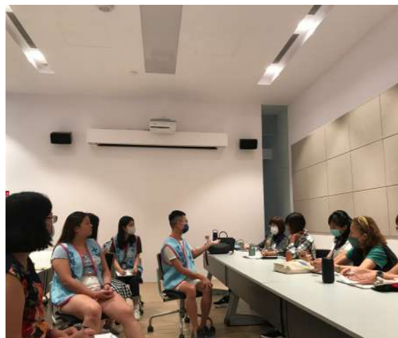
圖 7 活動後聆聽醫學院學生志工的意見，也是反思實踐活動的一環。

相關的培訓與共學，都是在為要將近用服務從週四專案日擴散出去做準備。「我在學藝術對談」共學團有了實際服務照顧者的經驗後，還陸續將藝術對談的創齡服務方案應用在週四以外的預約團體，如：臺中榮總安寧病房遺族團體的接待（2022/11/03）、2022 年金點獎績優據點及長照服務人員的參訪團接待（2022/11/20）、失智家庭美術節近用活動（與中山附醫失智共同照護中心合作，2023/03/27）、國際失智症聯盟（Dementia Alliance International, DAI）成員也是日本橘門（Orange Door）創辦人丹野智文先生以罹患失智症十年的經驗與台灣失智家庭交流團接待（2023/04/26）等。透過持續不斷的共學與實作，「我在學藝術對談」共學團的運作及服務模式，獲得了中山附醫失智症共同照護中心郭慈安副院長的肯定，從 2023 年下半年起，每兩個月一次的星期三午後、邀請兩個失智家庭到國美館參加「友智藝同：識能、藝術之旅」藝術對談活動（2023/08/23、10/18、12/20）。活動帶領者不只在藝術對談中，仔細聆聽服務對象的所思所感所言，並且延續共學團的創齡服務精神，於活動後聽取服務對象及醫學院學生志工們的回饋意見，館方工作人員及觀摩見習的所有團員更是在訪客離開後，關起門開檢討會，互相貢獻精進意見。