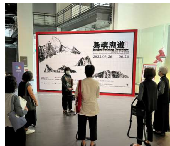
圖 4 共學團自主學習演練及研討